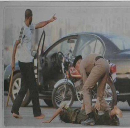
رجال الأمن في استعراض السيطرة على مسلح في سيارته