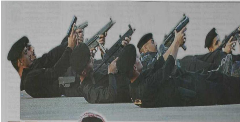
استعراض لهارات استخدام السلاح