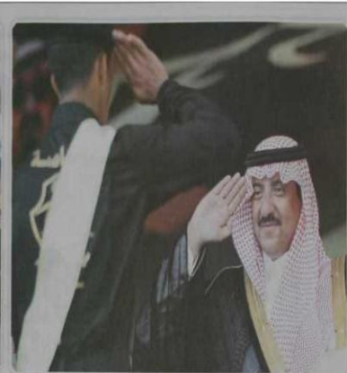
الأمن محمد بن نايف معنياً لمس خرجاً من بوزرات الطبية التأهيلية في مدينة نجران الأمن العام في مكة التمشير حسن القرني «عكاظ»

محمد بن نايف يدفع بـ ١٤٩٧ رجل أمن إلى ميدان العمل في مكة وبشبه اليوم تخريج ١٢٦٢ عنصراً في المدينة