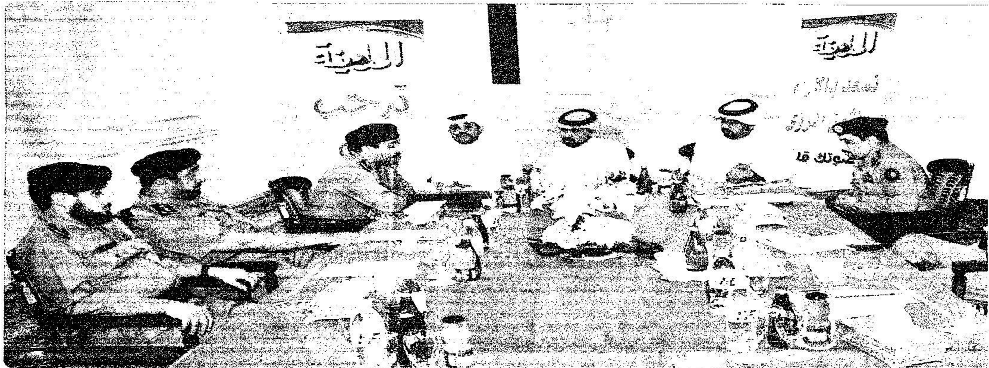
المشاركون في ندوة المدينة يؤكدون على الاستعدادات الجيدة للموسم ويدعون الحجاج للالتزام بالتعليمات

أكد عدد من القيادات الامنية العاملة في موسم الحج أهمية الاستمرار في حملتي (الحج عبادة وسلوك حضاري) و (لا حرج إلا بتصريح) بعد النجاح الكبير الذي حققته في تخفيف حدة الاقتراش والزحام في المشاعر المقدسة في العام الماضي . واكدوا ان نجاح الموسم يقتضي تعاون المواطنين والمقيمين في الالتزام بالتصاريح وبعثات الحج بتوعية الحجاج قبل القدوم . و اشاروا الى انه لن يتم السماح بدخول