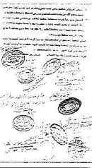
صورة توثيقية للشكر للإقليم المحافظ

طالب عدد من المزارعين في الطائف ومحافظات رنية ودرية والخزامة ومراكز الطائف الجنوبية بالرياض بإجراء قرار صندوق التنمية الزراعية بمحافظة الطائف وتخفيض مستواه إلى مكتب وضمة والمكاتب التابعة له في كل من رنية والخزامة ودرية لفرع صندوق التنمية الزراعية بمحافظة جدة، الأمر الذي سيكبدهم مائة كبيرة خاصة عندما سيضطر المواطن (الأحراج) لتكبد عناء السفر وقطع أكثر من ٦٠٠ كيلو متر في سبيل تقديم أو مراجعة طلب بسيط، وتقديراً إلى ذلك بخطاب عمالي محافظ الطائف هدد بن عبد العزيز بن معمر، أكدوا من خلال حجم المعاناة التي تنتهجهم والظن العرثي على هذا القرار.