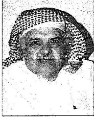
زينف الله ززاف