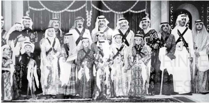
صور تذكارية من مراسم حياة الملك عبد الله