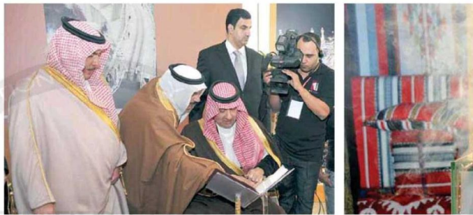
دشن من تذهن العررض والموسوعة الص.

بعد ذلك أعلن صاحب السمو الملكي عبدالعزيز بن عبدالله بن عبدالعزيز رئيس موسوعة المكتبة العربية السعودية التي تجاوزت فيها قرابة عشرة سنوات وفارقها نحو 250 باحثا وأكاديميا وتعد من أضخم الأعمال الثقافية الحديثة في المملكة في 20 مجلدا تغطي كافة جوانب الحياة في جميع المناطق، وتضم مجلدا متكاملة وحفظها للتعريف بالملك. وتحتوي الموسوعة على مجموعات حصرية من الصور الفوتوغرافية التي التقطها عدد من الصحفيين تم إخراجها رسميا بمناسبة بلوغ عدد هذه الموسوعة ما يقارب 100000 صورة لتتراجم ما بين 1000 - 1500 صورة لكل منطقة من مناطق المملكة، وقد خصصت جميع صور الموسوعة للرابضة التاكيد من مطابقتها للعادة العلمية، ووجدتها بالإضافة إلى الأمانة الفنية، حتى الحاصل وزير الثقافة والأعلام الدكتور عبدالعزيز بن محيي الدين خوجة، ومدير جامعة الملك سعود الدكتور عبدالله بن عبدالعزيز المشايخ وعدد من الأساتذة والأكاديميين والباحثين بالمشايخ.