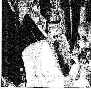
الملك عبدالله يتابع فقرات حفل الخطابي