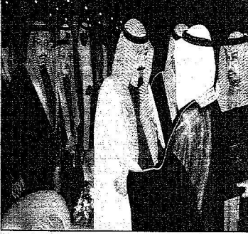
خادم الحرمين خلال تكريم الأئمة عبد الجبار ويسام الملك عبدالعزيز الذي تلمحه قبالة عنه الشريف العربي