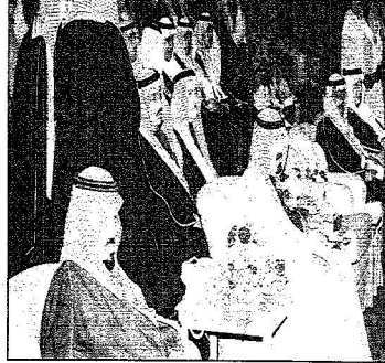
الملك عبدالله وأصحاب العمود الأمامي يتكلمون فترات الحفل