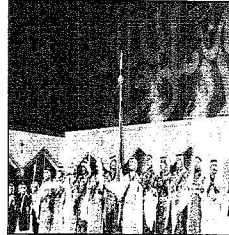
لوحة قديمة قدمها المشاركون في الأوبريت

الفريق أول ركن متعب بن عبدالله: رعاية وتشجيع الملك عبدالله حول المهرجان إلى واحد من معالم النهضة السعودية