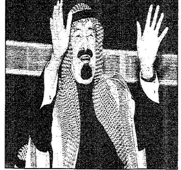
خادم الحرمين يحيي المشاركين في الأوبريت والحضور

الملك عبدالله كرم الأديب عبدالله عبدالجبار بوسام الملك عبدالعزيز من الدرجة الأولى