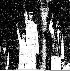
الأوبريت تميز بمشاركة مجموعة من الأطفال