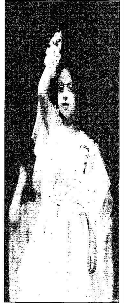
زهرة مشاركة في لوحة قديمة قدمها الأطفال خلال الحفل