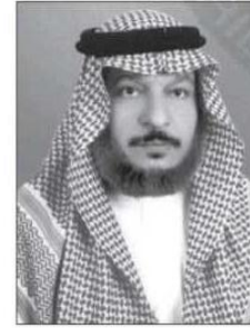
مدير فرع وزارة التجارة والصناعة بالمجمعة