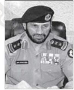
مدير شرطة المجمعة