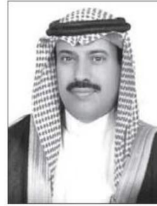
وكيل محافظة المجمعة