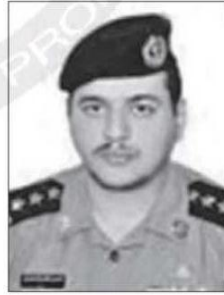
مدير مرور المجمعة