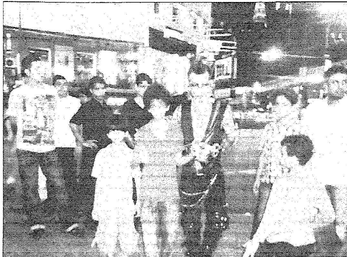
سياح عرب وأجانب في عرض ترفيهي في شارع عيون عربية في منطفة بوكت بنتانج - كوالالمبور عقب الإفطار في ٢ رمضان

ويشتهر هذا الشارع بتنوع الأكلات والفواكه التي تصدرها ماليزيا ومن أبرزها (دراغون فروت) الحمراء والبيضاء ويطلق عليها فاكهة التنين، كما يضم الشارع ذاته حوالي ١٠ مطاعم عربية تجتمع فيها العوائل العربية والسياح والماليزيون الباحثون عن تغيير طابع أكلاتهم، إلا أن الأبرز في هذا المشهد هو اختفاء الأكلات الغريبة بشكل كامل، وبينما يكون الشارع مكتظا بهذه الصورة إلا أنه فور انتهاء صلاة المغرب يتفرق الناس وتكون الساحة خالية تماما من المشهد الذي كانت عليه قبل الصلاة