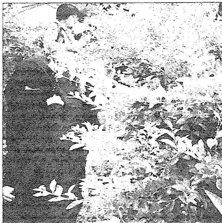
سائحة سعودية تتجول في حديقة الفواكه في بينانج الماليزية غرة رمضان.

والحضارات في تسهيل الدعوة إلى هذا الدين العظيم عندما نأخوهم غير المسلمين فنحن نركز على المشتركات والجوانب الإيجابية، وقد نجح أسلوب منح الهدايا لهم لتأليف قلوبهم على الإسلام. ويضيف بلخضري موقف حصل لي قبل أربع سنوات في ماليزيا حين دعيت إلى برنامج المسلمين الجدد، فجاءتني امرأة صينية لتشكرني وأرادت أن تصافحتني فاعتذرت لها وقلت لها بحكمة: لا يمكنني أن أصافحك لكوني على وضوء، فعذرتني متفهمة لوقفي