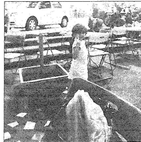
طفلة سعودية تلبو عقب تناول الإفطار مع أسرتها في شارع العرب في كوالالمبور ٢ رمضان.

ويشكلون الأغلبية، والصينيون والهنود، وذلك ما أدى إلى وجود ديانات مختلفة أيضا مثل الإسلامية والهندوسية والبوذية وغيرها. وعلى الرغم من هذا التنوع يجد المتابعون الوحدة والوفاق الذي يسود الشعب الماليزي، وقد حصلت ماليزيا على استقلالها عن المملكة المتحدة في ٣١ أغسطس ١٩٥٧م. ويعتبر الإسلام هو الديانة الرسمية للبلاد والتي تشكل ٦٠ في المائة من عدد السكان، بالإضافة لعدد آخر من الديانات مثل البوذية والهندوسية والمسيحية.