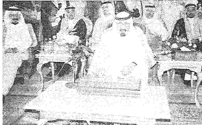
خادم الحرمين يبدن مشاريع وزارات التعليم العالي والنقل والمياه في حائل

عقب ذلك تسلم خادم الحرمين الشريفين الملك عبدالله