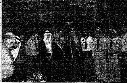
علم الحرمين يستقبل لمتناه الصحاف العالمية (ق 1 بر)

المصدر : الرياض التاريخ : 08-02-2006 العدد : 13743 الصفحات : 2 المسلسل : 6