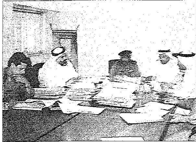
لجنة العفو خلال اجتماعها

تواصلت عمليات اطلاق سراح النزلاء المشمولين بمكرمة الملك بمناسبة شهر رمضان الكريم، وطغت الفرحة على الجميع وعبروا عن امتنانهم وسعادتهم بهذه اللقطة الانسانية الكريمة من خادم الحرمين الشريفين الملك عبدالله بن عبدالعزيز يحفظه الله المرحب دأبها على لم شمل الاسر وخاصة في هذا الشهر الفضيل.