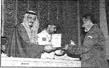
الأمير سلمان يكرم القيادات الكشفية