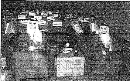
عدد من أصحاب السمو الأمراء خلال الحفل