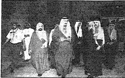
الأمير سلمان والأمير أحمد لدى وصولهما مقر الحفل