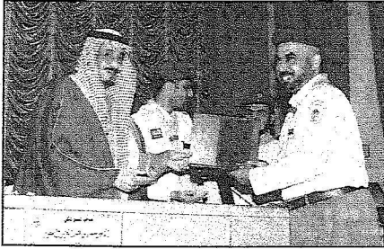
سمو خلال تكريم القيادات الكشفية

المتماهج والبرامج والانظمة الكشفية حيث استحدثت في السنوات الاخيرة استراتيجيات عشرية مبنية على الانظمة الكشفية العالمية وأنظمة المملكة