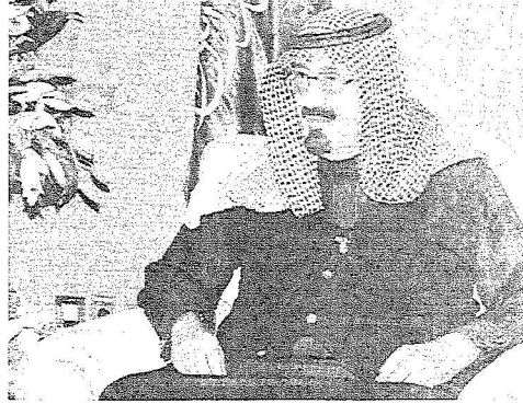
شيخ قبيلة آل عمير يتحدث للمحور

وكل أهالي الطائف فرحون وسعداء سعادة بالغة بمقدمكم ولقاؤكم وتشريفكم لهم.