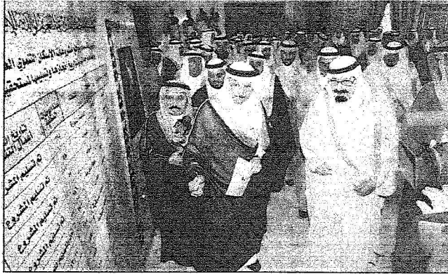
الملك عبدالله يستمع إلى شرح عن مشروع الإسكان التنموي

المصدر : الرياض التاريخ : 06-11-2006 العدد : 14014 الصفحات : 3 المسلسل : 11