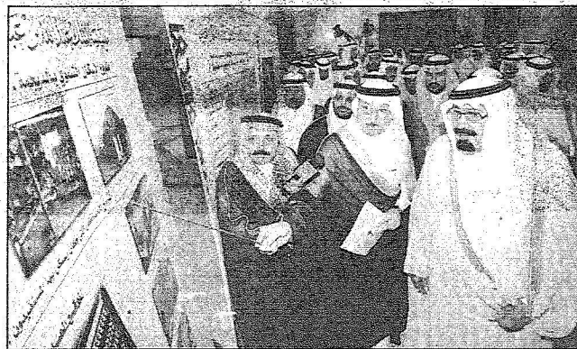
خادم الحرمين يطلع على مخططات مشروع الاسكان التنموي