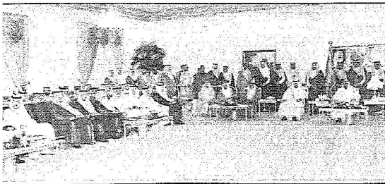
خادم الحرمين وولي العهد خلال الاستقبال

وابان أن المشروع في مرحلته الأولى يستوعب (3٧2) منزلا بتكلفة اجمالية مقدارها (١٠٠) مليون ريال ويتضمن المرافق الاساسية من المساجد والمدارس لتبنيته والبنات ومركزا للرعاية الصحية ومركزا