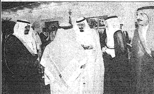
خادم الحرمين يسلم الوثائق للمستفيدين من المشروع

د. المشيمين: المرحلة الأولى من المشروع تستوعب ٣٧٢ منزلاً بتكلفة ١٠٠ مليون ريال