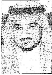
د. عبدالرحمن بن علي ناشب *

تعد جولة خادم الرحمن الشريفين الملك عبدالله بن عبدالعزيز الكريمة منطقة جازان حدثا هاما ومناسبا عظيمة اذ تعتبر