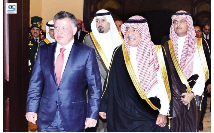
ولي ولي العهد يقيم حفل عشاء تكريماً لملك الأردن