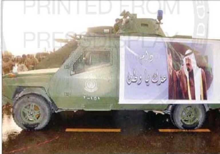
إحدى آليات الامن المشاركة في الحج