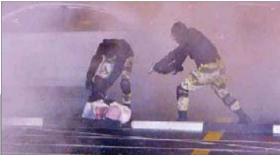
التبضع على المظلومين