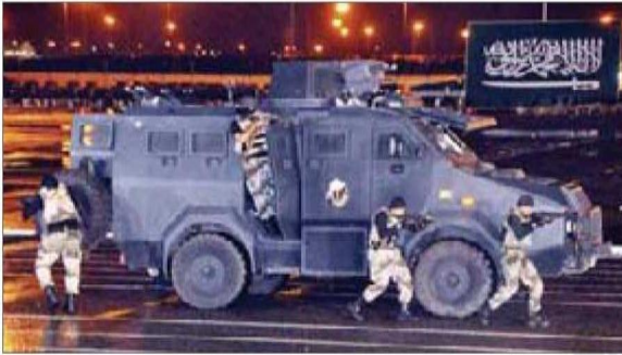
استعراض لاشتباك مع الإرهابيين