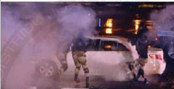
السيطرة على سيارة أحد الإرهابيين