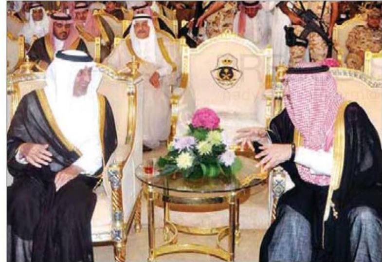
الأمير خالد الفيصل والأمير محمد بن نايف في حديث جانبي