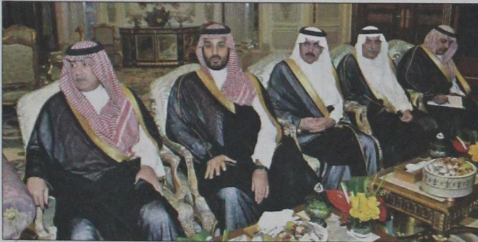
الأمراء عبدالعزيز بن عبدالله ومحمد بن سلمان والوزراء خلال الاستقبال

جدة. واس ■ استقبال خادم الحرمين الشريفين الملك عبدالله بن عبدالعزيز آل سعود . حفظه الله . في قصره بجدة مساء الاثنين أخاه صاحب السمو الشيخ تميم بن حمد آل ثاني أمير دولة قطر.