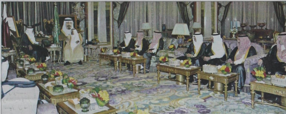
جانب من الاستقبال