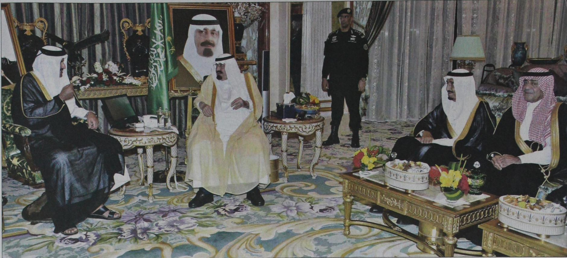
خادم الحرمين مستقبلاً الشيخ تميم وفي الصورة الأمير سلمان والأمير مقرن