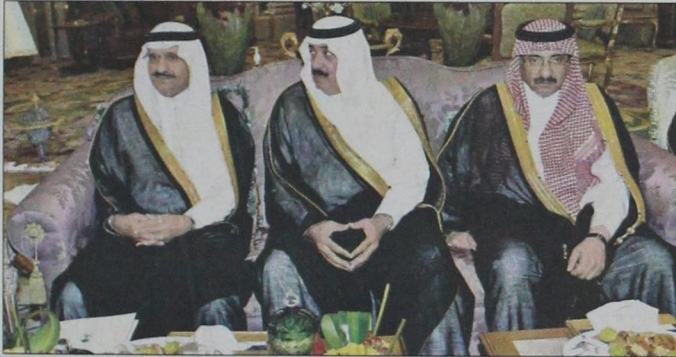
الأمراء خالد بن بندر ومتعب بن عبدالله ومحمد بن نايف