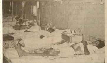
المؤمنون داخل المستشفى وقد أجريت لهم كافة الإسعافات من ضربات الشمس