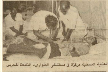
العناية الصحية مركزة في مستشفى الطوارئ التابعة للحرس