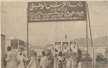
الحرس الوطني ولقطة من المعسكر الطبي للخدمات