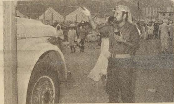
تنظيم حركة السير