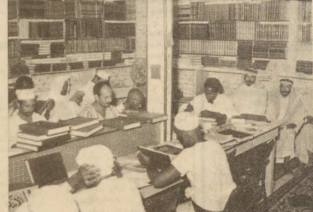
الدين والثقافة والادب في المكتبة الكبيرة التابعة للحرس