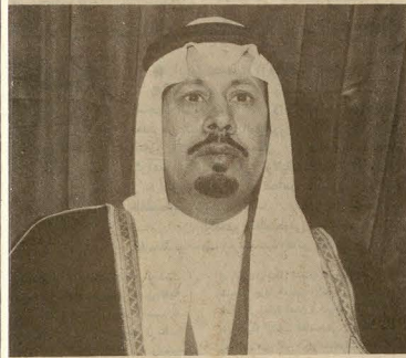
سمو الأمير بدر بن عبدالعزيز

والمستشفى على علاج أفراد الحرس الوطني بل عالجت أيضاً أعداداً كبيرة من حجاج بيت الله الحرام ٠٠ وقد بلغت أعداد الحجاج الذين عولجوا من هذه العيادات أكثر من ١٣ الف حاج . . . وقال أحد الأطباء المعالجين بمستشفى الطوارئ أن ٦٠٪ من الحالات قد أصيبت بضربات شمس ونزلات معوية أمكن علاجها . بالإضافة إلى كل ذلك كان لشباب مدارس الحرس الوطني دور كبير مسانداً في تنظيم حركة السير بالطرق العامة في المشاعر المقدسة . وقد أشاد سمو الأمير ماجد بن عبدالعزيز أمير منطقة مكة المكرمة وسمو الأمير سعود بن عبدالمحسن نائب أمير منطقة مكة المكرمة بهذا الدور الحيوي للحرس الوطني في كافة المجالات الذي تم تنفيذه بدعم وتوجيهات من صاحب السمو الملكي الأمير عبدالله بن عبدالعزيز النائب الثاني لرئيس مجلس الوزراء ورئيس الحرس الوطني وسمو نائبه الأمير بدر بن عبدالعزيز وبتقاعه سمو الأمير خالد بن عبدالله نائب رئيس الحرس الوطني للمنطقة الغربية .