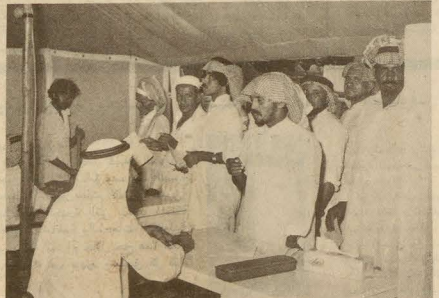
الطبيب السعودي والحرس الوطني يستمع بدقة لحالة المريض