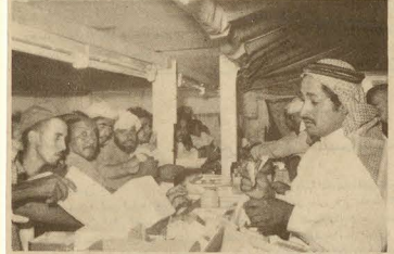
صرف الأدوية للمعالجين من الحجاج بالعيادات .