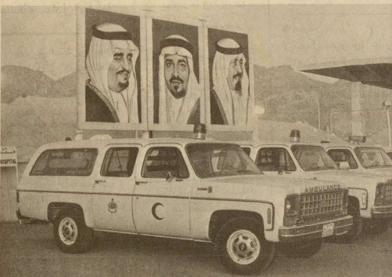
كانت سيارات إسعاف الحرس الوطني على أهبة الاستعداد لتقديم أي خدمات للحجاج