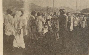
ويظنلون حركتهم أثناء الاتجاه إلى الجمرات .