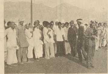
جنود الحرس الوطني يردون على استفسارات الحجاج