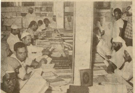
جموع كبيرة من محبي الإطلاع تردوا على المكتبة