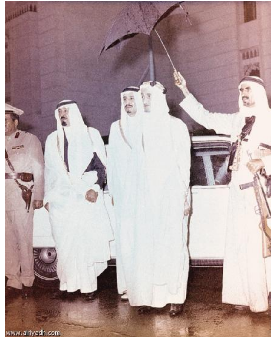
الملك عبدالله إلى جوار الملك فيصل - رحمه الله - ويبدو الأمير سلمان في احدى المناسبات تحقيق - محمد الغنيم

التمسك الشديد بالعقيدة والوطنية الجياشة والبساطة في العيش والكرم ورحابة الصدر ومكارم الأخلاق.. جزء يسير من صفات عديدة يتحلى بها ملك الإنسانية والقائد الفارس الفذ خادم الحرمين الشريفين الملك عبدالله بن عبدالعزيز حيث يمثل العام ١٣٤٣هـ الموافق ١٩٢٤م مولد هذه الصفات في شخصيته حيث ولد الملك عبدالله في ذلك التاريخ ونشأ في محيط العقيدة الصافية والقيادة الواعية وشمائل الفروسية والارادة والشجاعة التي تعلمها من مدرسة والده الملك المؤسس عبدالعزيز - طيب الله ثراه - فعندما نبحت في نشأة الملك عبدالله وسيرته نجد أنفسنا بحاجة إلى وقت طويل حتى نخوض في كل الجوانب المشرقة في حياة هذا الملك المحنك الذي نهل وتعلم من مدرسة المؤسس الكثير من العلوم والمعارف والخبرات الواسعة التي أكسبته كل ما يحتاجه أي زعيم ليقود بلاده إلى الأمام في عالم مليء بالمتغيرات والصعاب التي تتطلب الكثير حتى تسير السفينة إلى بر الأمان