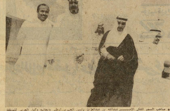
* صاحب السمو الملكي الامير عبدالله بن عبدالعزيز رئيس الحرس الوطني وبجانبه وكيل الحرس الوطني القريه الشيخ محمد البيان .

لكن العنق الجبار . والعمل الدائب المثر علامة بارزة على الطريق الطويل . فلا يمكن ان يحجب آثاره وعمله . لانه عمل . اي انه خطوة . اي انه كبرياء . لا بد ان يلهمه كل انسان . وعندما تحدث العمل . بيت وبرزت جهود هذا الجهاز الكبير . صاحب الحرس الوطني . ولقد كان صاحب السمو الملكي الامير عبدالله بن عبدالعزيز رئيس الحرس الوطني في مقدمة الذين صنعوا الاعمال الكبيرة تنفيذاً لرغبة القائد . والياتي جلاله الملك فيصل العظم . مسترشداً في ذلك بتوجيهات جلالاته . واذا كان الحرس الوطني قد عمل دوماً من اجل الواجب . ومن اجل تحقيق الاهداف الكبيرة . فان هذا العمل اعزوه والذي يعتبر عملاً عظيماً . وهو الحديث الذي كد العتاق وندمهم بالارزاق . وهو الحديث الذي اهل على لسان صاحب السمو الملكي الامير عبدالله بن عبدالعزيز رئيس الحرس الوطني . والذي اطلق به الى الزميلة جريدة « الدعوة » . وهو حديث يتسم بالصداقة . والصرافة .