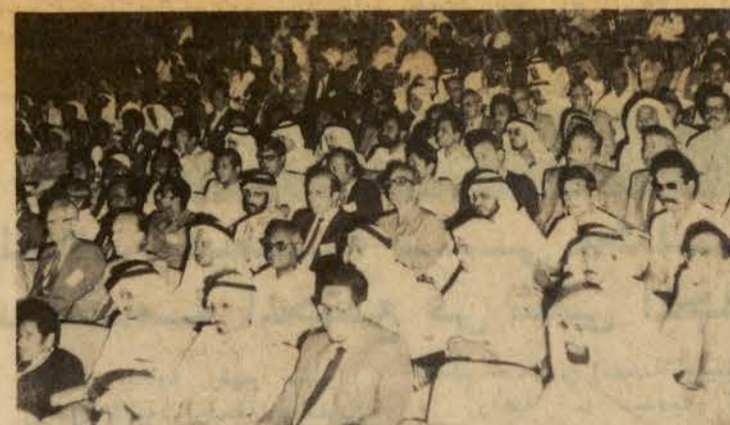
حضور الجلسة الختامية من الاطباء

بعض الاقتناع الا انه نظرا للظروف التي هم يعيشون فيها قد يستصعب الدخول في الاسلام مباشرة.. انما ما نرجوه لهذا المؤتمر هو ثمرة كبيرة وان يكون امتدادا لمؤتمرات لا تقتصر على الاعجاز العلمي في القرآن في الطب فحسب ولكن تكون في الطب وعلم الجيولوجيا والفلك وغيرها من العلوم التي يشير اليها القرآن اشارة مجملة.. وازداد الشيخ العثيمين بانتي اؤكد على جميع الباحثين في الاعجاز العلمي للقرآن الا يتسرعوا في تطبيق ما علموه على ما جاء في القرآن حتى يتقنوا ذلك بالمشاهدة التي لا يمكن انكارها او التشكيك فيها في المستقبل لاننا اذا اخضعنا القرآن للنظريات المستجدة اذا لم تكن مبنية على المشاهدة المحسوسة فانه قد تأتي نظريات تبطل تلك النظرية فاذا