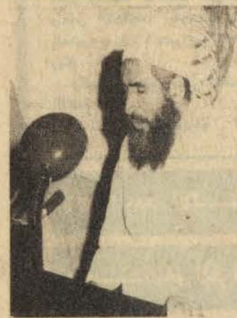
الشيخ عبد المجيد الزنداني