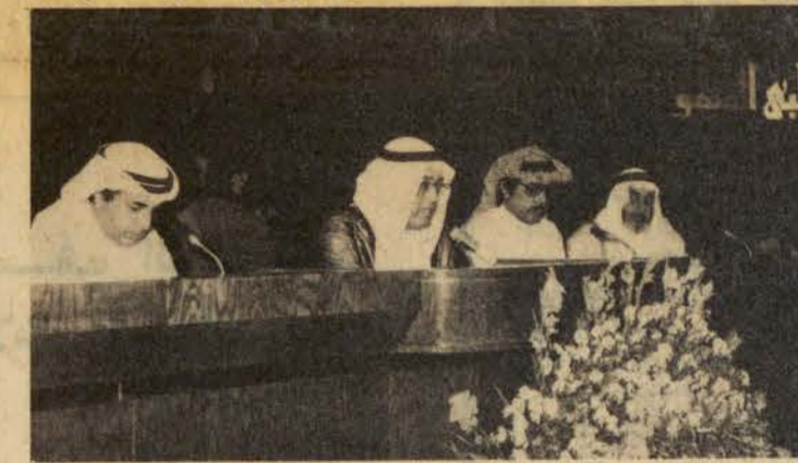
د. غازي القصيبي في الجلسة الختامية

ربطناها بدلالة القرآن والسنة صار ذلك طعنا في الكتاب والسنة وحصل منه نتيجة عكسية.. فالذي اريده واؤكد على اخواننا الباحثين في هذه الامور الا يتسرعوا في الحكم على النظريات العلمية سواء في الطب او غيره باستنتاجها من القرآن حتى تكون ظاهرة للعيان والمشاهدة الملموسة واقول هنا ان القرآن الكريم والسنة النبوية جاءت بالامور الاجمالية في هذه الابواب لاجل ان تفتح للناس باب التعقل والتفكير حتى يستنتجوا هم بانفسهم ما يحصل لهم من هذه الامور ولم تات في التفصيل في هذه الاشياء لان التفصيل في بعض العصور وعند بعض الامم قد يكون من الامور التي لا تدركها عقولهم فيحصل بذلك التكذيب.. فلوان القرآن جاء بتفصيل ما سيدحت من المركوبات ومن الوسائل