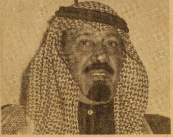
صاحب السمو الملكي الأمير عبد الله بن عبد العزيز النائب الثاني لرئيس مجلس الوزراء ورئيس الحرس الوطني

ليست الإندية وحدها هي التي تعد النجوم والأبطال وتتعهد الناشئين بالريادة والاهتمام .. فهناك جهود اثمرت وحققت تفوقاً ملموساً في المجال الرياضي حيث يقوم الحرس الوطني بدور كبير ويساهم مساهمة فعالة في تدعيم النشاطات الرياضية واللعبات المختلفة بالنسبة للأبطال بين جنود الحرس الوطني وايضا مع الناشئين في مراكز التدريب التي انشئت في العديد من مناطق المملكة في لعبات كرة القدم واليد والطائرة والعباب القوى وتنس الطاولة والجمباز والشيخ والسلاح والسباحة وغيرها من اللعبات .