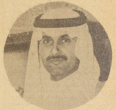
الامير خالد بن عبد الله رئيس النادي الاهلي

وكان لتوجيهات صاحب السمو الملكي الامير عبد الله بن عبد العزيز النائب الثاني لرئيس مجلس الوزراء ورئيس الحرس الوطني الاشر الكبير في تطوير هذا النشاط .. وسموه لياكو جهدا في سبيل تقديم كافة الامكانيات والرعاية لأبطالنا في الحرس الوطني كما تلقى الفرق الرياضية المختلفة كل اهتمام من سمو الامير بدر بن عبد العزيز نائب رئيس الحرس الوطني