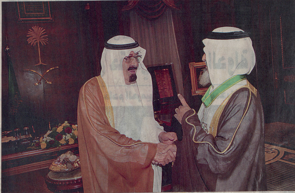
الملك مقلدا محمود بن نايل بن طوغان السويدي الشمرى وسام الملك عبد العزيز من الدرجة الأولى أمين بن جدة

وأبرزت منديبات ومواقع على الإنترنت روابط وأقسام خاصة ترحيباً بزيارة الملك، مضمين روابطهم بعدد من القرارات التي أعلنها الملك إبان الزيارات الأخيرة للمدينة المنورة خلال السنوات الأربع الماضية، أبرزها توسعة ساحات الحرم النبوي وتدشين العديد من المشروعات الخدمية والصحية والتعليمية التي وضعت المدينة في عين التنمية.