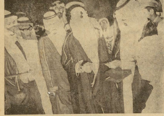
● جللة الفصل .. بفتح المباني الجديدة مدارس الحرس الوطني العسكرية والفنية .. يومئى نادى الحرس الوطني ..

رجال وحدة الاطباء من مشيبي الحرس الوطني .. يقومون باجههم يحفظون مواصلاتها ، للتون والامدادات والاتصال بالمائم المستمر .. والورش والتقليبات في اهميتها والنسبة للحرس الوطني تالفة للمدارس العسكرية والفنية فالحركة السريعة في الوقت المناسب ، وتأمين المواصلات وخطوط الاتصال بين مختلف الوحدات العسكرية الفاربية في حالي السلم والحرب ، من الامة التي تجد منذ قديم الزمن في الاستراتيجية العسكرية العنانية والرياسة ، ويحب لها كل الصواب .. ذلك ان القوات المسلحة لا تستغنى عن عبات الانشمار ، والمرباطة في نقاط متباعدة الامر الذي يفرض على اية قوات مسلحة ان تعنى العناية التامة