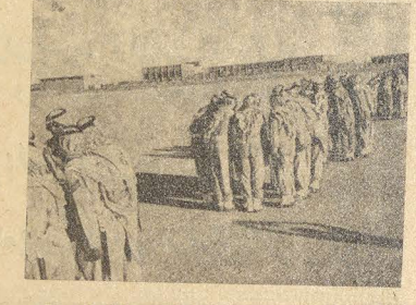
● بين التسمي يردد افراد ثورة الولا بالدارس العسكرية والفنية ..

الامر بدر بن عبد العزيز نانيا لرئيس بعد ذلك بايوم وبأ الحرس الوطني بشق طريقه بالجهد الواق ، والعلم الحديث ، والتخطيط الشامل ، والقيادة الحكيمة ، فى ميان وجوده العسكري حتى اصبح وخلال عقد واحد من