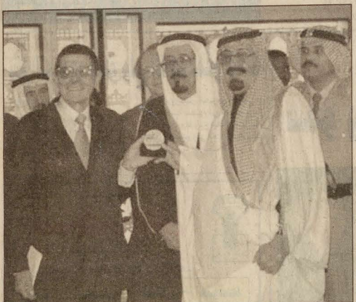
سمو ولي العهد يتسلم هدية تذكارية من مدير معهد العالم العربي

حفظ الله وعلية شأنه وصاحب السمو الملكي الأمير عبد الله بن عبد العزيز ولي العهد نائب رئيس مجلس الوزراء ورئيس الحرس الوطني بباريس من أجل ما قام به سموه من زيارته لفرنسا التي شهدت توقيع سموه على ميثاق التعاون بين بلدينا في مجالات التعليم والثقافة والتجارة والاستثمار.