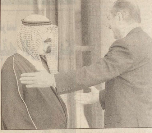
سمو ولي العهد الأمير عبدالله بن عبدالعزيز قوبل بحفاوة بالغة من القيادة الفرنسية

عبدالله بن عبد العزيز رئيس مجلس الوزراء ورئيس الحرس الوطني بباريس من أجل ما قام به سموه من زيارته لفرنسا التي شهدت توقيع سموه على ميثاق التعاون بين بلدينا في مجالات التعليم والثقافة والتجارة والاستثمار.