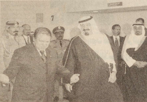
سمو ولي العهد وفخامة الرئيس الجزائري