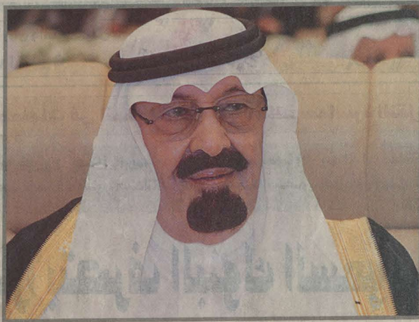
تطوير قصر خزام

ويشمل حفل الافتتاح المعرض التجاري الرسمية للمشروعات التنموية الكبرى بمشاركة مكة المكرمة، بمشاركة من الجهات الرسمية والقائمين على المشاريع من القطاع الحكومي والخاص