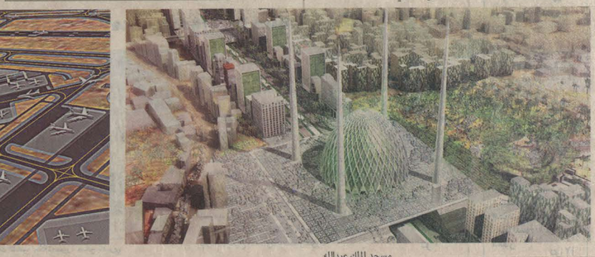
مسجد الملك عبدالله