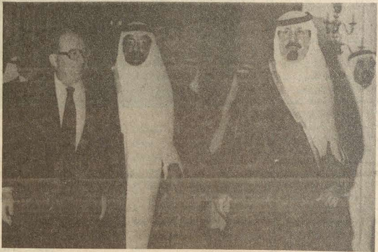
سمو الامير عبدالله بن عبدالعزيز ودولة رئيس وزراء مالطا اثناء التوجه الى مادبة العشاء التي اقامها جلالة الملك خالد المفدى تكريما للضيف