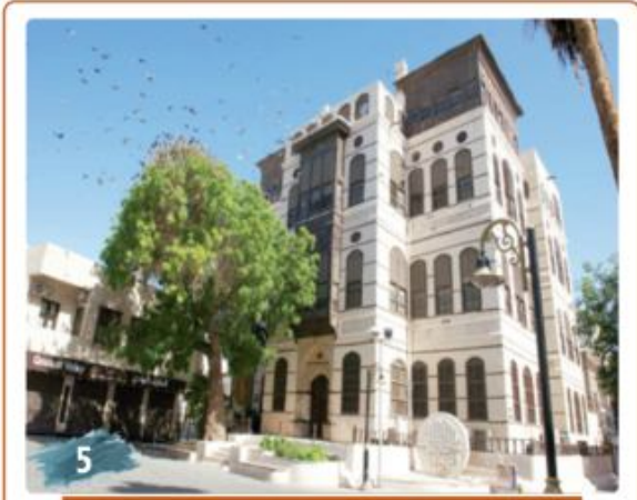
«جدة التاريخية».. متحف مفتوح

الرياض - مياره العكاش كشفت وزارة العدل أن محاكم المملكة كافة عقدت خلال أيام عمل الأسبوع المحرم نحو 44 ألف جلسة قضائية، وأصدرت ما يزيد على 15 ألف حكم قضائي، بالإضافة إلى أكثر من 26 ألف عملية في محاكم التنفيذ، تنوعت بين قرارات صادرة وإجراءات منقذة. وقدمت المرافق العملية خلال نفس الفترة ما يزيد على 163 ألف خدمة للمستفيدين تنوعت بين عمليات توثيق وتنفيذ وكذلك الخدمات التي تقدمها المحاكم. وبلغ إجمالي العمليات التي تم تنفيذها في المحاكم كافة (بوزن التنفيذ) 81360 عملية، فيما قدمت محاكم التنفيذ 26082 خدمة للمستفيدين خلال الأسبوع المحرم، أما عمليات التوثيق فبلغت 55539 عملية خلال الفترة ذاتها. وكان معالي وزير العدل رئيس المجلس الأعلى للقضاء الشيخ الدكتور وليد بن محمد الصمغاني، بالسرعة اللازمة.