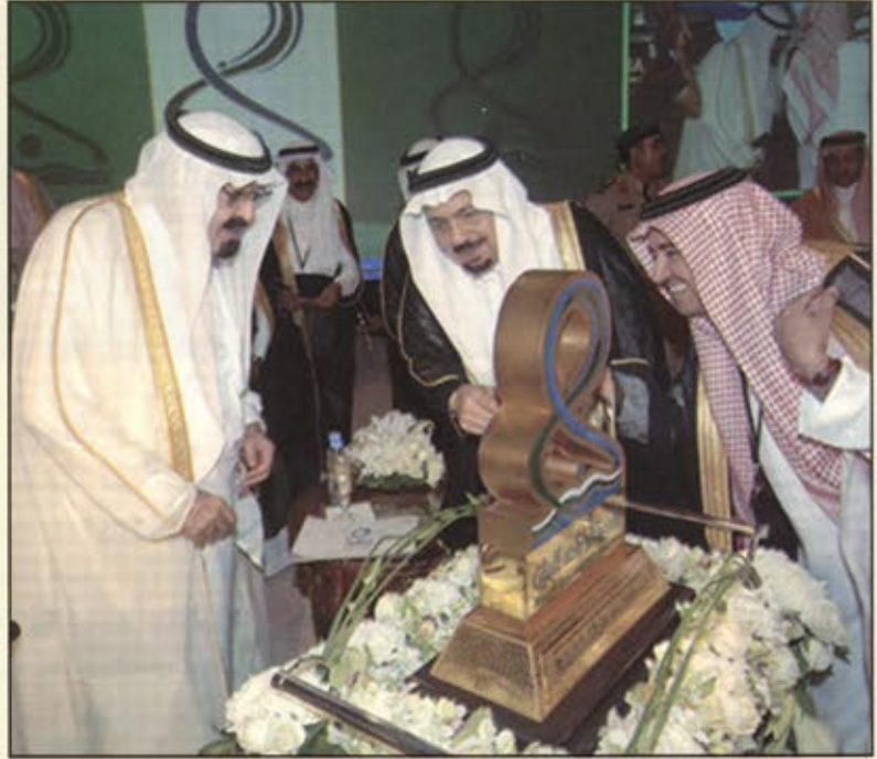
الملك عبدالله بن عبدالعزيز خلال رعايته تأسيس جامعة البنات

اللغات والترجمة الضرورية وكلية رياض الأطفال وكلية التربية وكلية الاقتصاد المنزلي وكلية التصاميم والفضون وكلية الآداب وكلية الخدمة الاجتماعية مفيضة انه ٢٦ الف طالبة يدرسن في هذه الكليات هذا العام حيث يقوم بتدريسهم "١٣٥٠" عضو هيئة تدريس يعاونهم "٢٦٣٨" من الفنيات والفضيين والإداريات والإداريين .