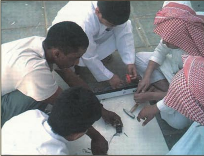
التعليم في المملكة شهد تطوراً كبيراً في السنوات الأخيرة

عالمي مستقل مادياً وادارياً يعتمد على أسس أكاديمية عالية ليكون قاعدة علمية ومحركاً للاقتصاد الوطني في الوقت ذاته وربط كل ذلك بمجال الطاقة والاقتصاد..