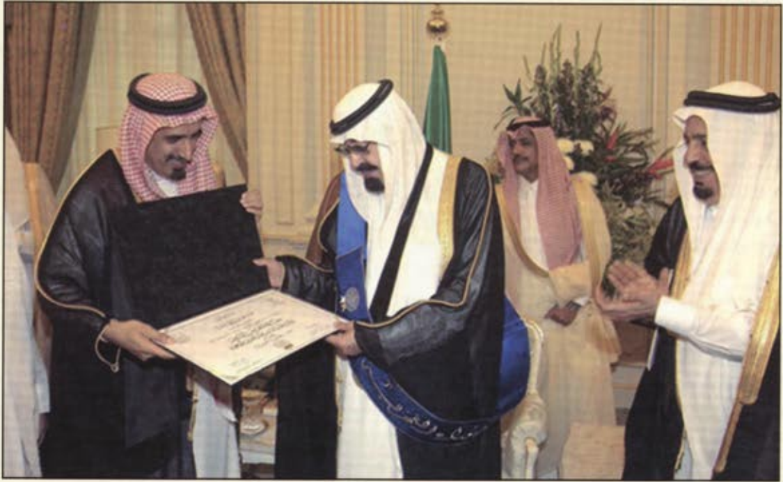
خادم الحرمين الشريفين يتفضل باستلام الدكتوراه الفخرية

حفظه الله- عن تغيير مسمى جامعة الملك عبد الله للبنات الذي أوصى به مجلس جامعة الرياض للبنات ليكون اسما للجامعة إلى جامعة الأميرة نورة بنت عبد الرحمن وقال الملك عبد الله في كلمته خلال الحفل: بسم الله الرحمن الرحيم أشكر الأخ خالد والأخت الجوهرة على هذه التسمية.. ولكن بعد استشارتي للرب عز وجل تسمى هذه الجامعة باسم (الأميرة نورة بنت عبد الرحمن)..