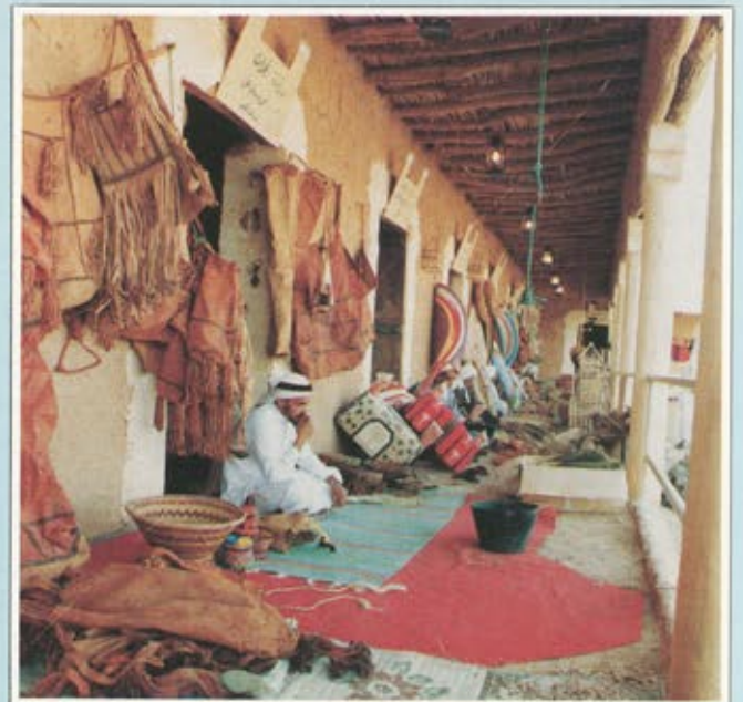
الحرف اليدوية في السوق الشعبي بالجنادرية

التراث العربي المشترك تنبثق به ذاكرة التاريخ الانساني لجهود الانسان العربي الأول وهو يشق طريقة بالارادة والاصرار والابتكار على ظهر هذا الكوكب . ويؤكد سعادة الدكتور عبدالرحمن السبيبت وكيل الحرس الوطني للشؤون الثقافية والتعليمية ورئيس اللجنة العامة للمهرجان أن المهرجان في هذا العام سيكون بمشيئة الله استمرارا للنجاحات التي تحققت، وقد حشد الحرس الوطني العديد من الفعاليات الجديدة التي نأمل أن تحظى بإعجاب الجمهور والمتابعين.