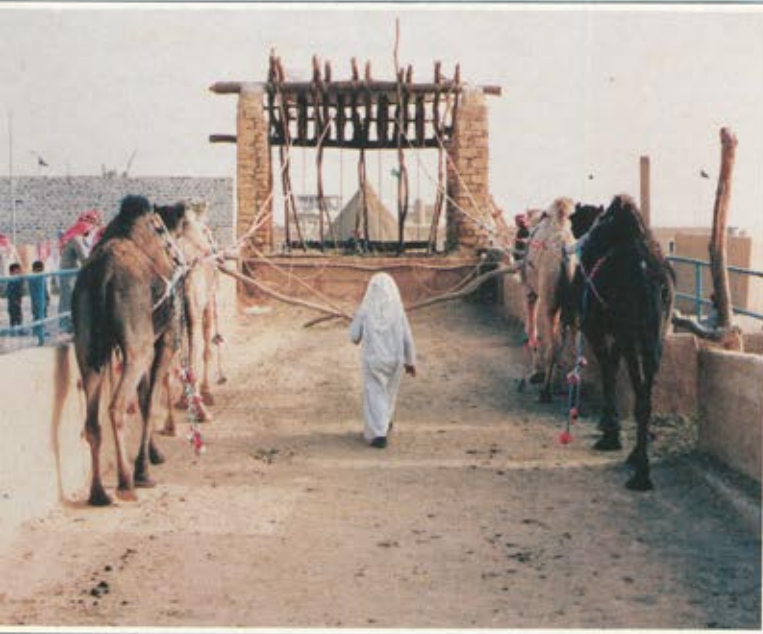
السواني.. تراث الاجداد يشاهده الاحفاد