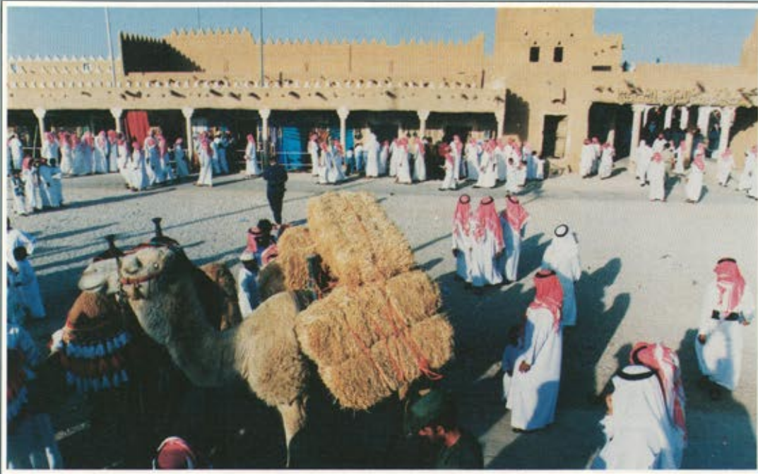
يحظى مهرجان الجنادرية كل عام باهتمام الجميع من مختلف الاعمار