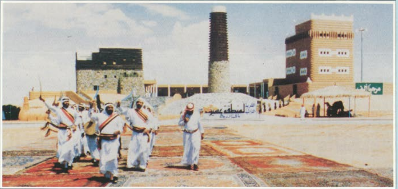
الفرة التراثية بمنطقة عسير ورقصة شعبية

البشرية والمادية لانجاح نشاطات هذا المهرجان التاسع. والذي يشاهد الجنادرية هذه الايام يجد حركة دائبة ونشاطا ملحوظا حيث يبذل العاملون في المهرجان في كافة لجانه جهودا كبيرة ومتواصلة في التجهيزات والاستعدادات للنشاطات، وفي