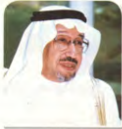
الشيخ عبدالرحمن فقيه: عرف عن خادم الحرمين الشريفين الوفاء والصدق والنبل