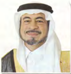
د صبحي بترجي: شهدت المملكة منذ مبايعة خادم الحرمين الشريفين العديد من الإنجازات على أرض الواقع

الإنجازات الرائعة بدأت صورتها أكثر بريقاً وجاذبية بأولئك الذين يرغبون في إيجاد علاقات سياسية واقتصادية واجتماعية وتعليمية، حيث قفزت الجامعات في عهده من سبع جامعات إلى أربع وعشرين جامعة إن لم تخني الذاكرة أي أكثر من ثلاثة أضعافها، حيث غطت جميع أنحاء المملكة سواء ما كان في أطرافها أو وسطها على حد سواء، ولا شك أن هذه القفزة التعليمية في حد ذاتها إلى جانب إنشاء المدن الصناعية في الجبيل وينبع وجيزان وغيرها تعمل على تحقيق المعايير العالمية لتقدم الدول ونهضتها ومكانتها، ولا شك أن المملكة العربية السعودية في عهد الملك عبدالله بن عبدالعزيز قد قفزت هذه القفزات الرائعة والسريعة والفاعلة داخليا وخارجيا في زمن قياسي لا يقاس بمدة حكمه حفظه الله. ويؤكد د. أسامة البار بأن من زار المملكة قبل سنوات وزارها اليوم أو بعد عام ربما لا يعرف أن هذه هي المدينة أو المدن التي زارها قبلا؛ فالنهضة التنموية غير المسبوقة نقلت المدن السعودية نقلة حضارية كبيرة تضاهي أرقى المدن العالمية، وليست هذه النهضة حكراً على مدينة أو منطقة معينة، بل عمت كافة أرجاء البلاد قرى ومدناً صغيرة ومحافظات وصولاً إلى المدن الكبيرة والعاصمة؟