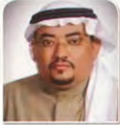
د. جبريل العريشي: تميز الفترة الحالية من عهد خادم الحرمين الشريفين بتطور ملموس في مجال حقوق الإنسان