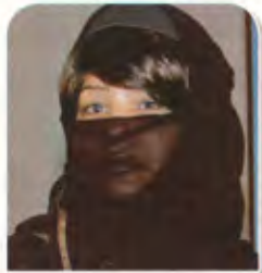
أسماء المحمد: أهم المتغيرات أراها على مستوى بناء الإنسان والتنمية البشرية

التنمية وإشراك المواطنين فيها. لقد قاد المسيرة إلى بر الأمان والأمن والاستقرار والاقتصاد القوي والإصلاح والتطوير والبناء، والاستثمار في الإنسان ثروة المملكة الحقيقية ومصدر قوتها. وحاول قائد مسيرتنا - يحفظه الله - بناء الدولة الحديثة لكي تكون في مصاف الدول المتقدمة، حيث بدأت المشاريع الاقتصادية تظهر في أفق التنمية في المملكة مما أكسبت الملك عبدالله احترام شعبه وتقديره، وعززت من شأن المملكة الاقتصادي على صعيد المحافل الدولية، وبالذات فيما يتعلق بصناعة القرار الاقتصادي العالمي.