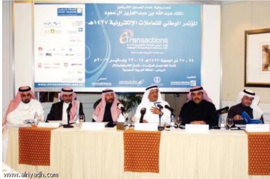
د.السويل خلال المؤتمر الصحفي

المحافظ السويل: الخدمات البنكية مثال حي على تطور الخدمات الإلكترونية بالمملكة