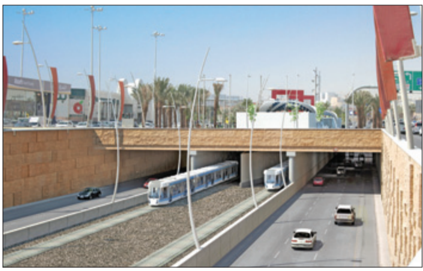
صورة تخيلية للمشروع في طريق الملك فهد

أعداد المركبات التي بلغت أكثر من مليون ونصف المليون مركبة، تقطع يوميا سبعة ملايين رحلة، وهو ما يتطلب توفير بدائل مستدامة وأكثر فاعلية للوفاء بمتطلبات التنقل القائمة والمتوقعة في المدينة. وحظي المشروع بدراسات مستفيضة أجرتها هيئة تطوير الرياض، وعلى معايير ومقاييس ثابتة أقرت عن وضع خطة شاملة لهذا القطاع شملت شبكة للنقل بالقطارات الكهربائية وأخرى للنقل بالحافلات، وروعي عند تحديد مسار الشبكتين، المواقع التي تتركز فيها الكثافة السكانية، مناطق الجذب المروري، مناطق المرافق الحكومية، الأنشطة التجارية والتعليمية والصحية، كما اشتملت على تجهيز مختلف عناصر المشروع من دراسات اقتصادية، تصاميم هندسية، ومواصفات فنية. ومن المنتظر أن يسهم المشروع بالإضافة إلى عوائده المباشرة على الاقتصاد السعودي والعمارة والمرافق والخدمات، في حماية البيئة بخفض نسبة تلوث الهواء، وتقليل التكاليف الناجمة عن الحوادث المرورية والازدحام، وغيرها من العوائد.