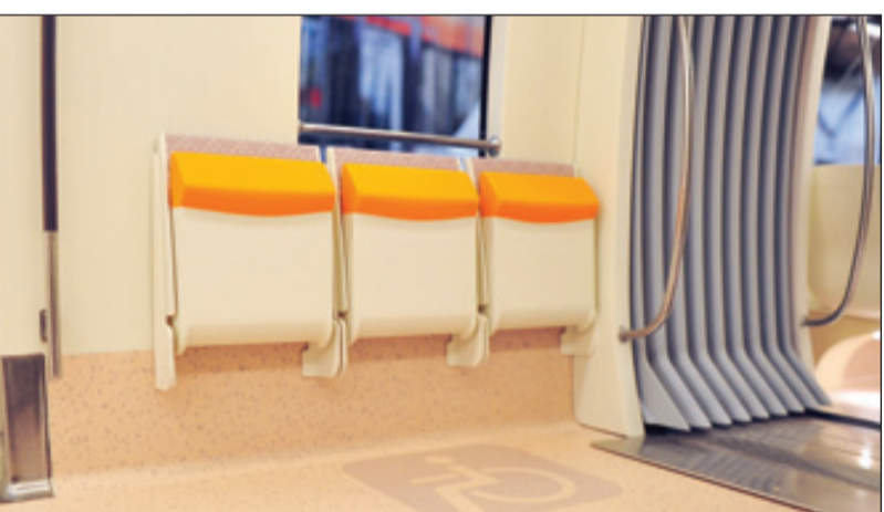
مقاعد مخصصة للمعاقين

الإدارة للمشاريع الكبرى. ويهدف المشروع إلى تيسير حياة المواطنين وتخفيف أعباء التنقل عن كاهلهم، ويجمع بين تعزيز مكانة المملكة، ودعم مقوماتها الحضارية كواحدة من أسرع الحواضر في العالم نمواً وبين مواكبة التنامي الكبير الذي تشهده المدينة في عدد سكانها ومساحتها. وتشير التقديرات إلى نمو عدد سكان مدينة الرياض من نحو ستة ملايين نسمة حالياً إلى أكثر من ثمانية ملايين ونصف المليون نسمة خلال السنوات العشر القادمة، إضافة إلى توسع مساحتها متجاوزة الثلاثة آلاف ومئة كيلو متر مربع، وتزايد