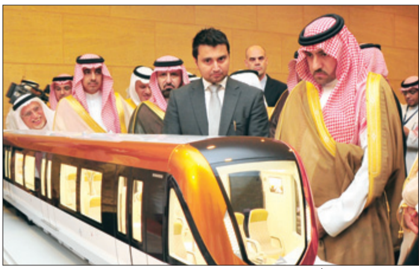
أمير الرياض يطلع على نموذج لعربات مترو الرياض من الداخل

الرياض - فهد الثنيان يعد مشروع مترو الرياض الذي يتم إنشاؤه حاليا أضخم مشروع للنقل قيد الإنشاء في العالم والذي وضع لبناته الملك الراحل عبدالله بن عبدالعزيز وتابع سير العمل فيه بشكل دوري مع كافة الجهات المعنية إيماناً من الراحل بأهمية المشروع الضخم الذي يهدف إلى تيسير حياة المواطنين وتخفيف أعباء التنقل عن كاهلهم. ونوه أمير الرياض الأمير تركي بن عبدالله في حديثه خلال اجتماع سموه مع الجهات المعنية المشرفة على المشروع مؤخراً بان الملك عبدالله وجه بسرعة إنجاز مترو الرياض وفق أعلى المواصفات العالمية وعلى أكمل وجه ليكون في متناول سكان الرياض في موعده المحدد. مشيراً بذات السياق بأن الملك عبدالله أولى اهتماماً كبيراً بالمشروع، بمتابعته للمستجدات في تنفيذه بشكل أسبوعي ان لم يكن بشكل يومي، منوهاً في هذا الصدد بالعمل في المشروع وفق روح فريق العمل الواحد واستباق التحديات والصعوبات بالحلول والبدائل.