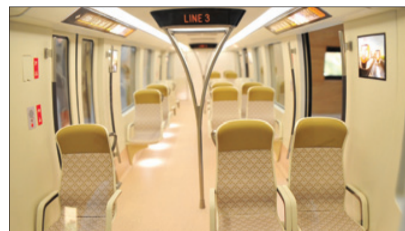
جانب من مشروع المترو