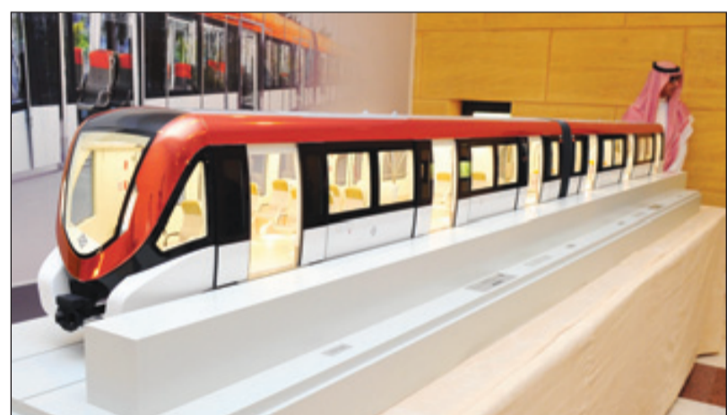
مجسم لعربات المترو