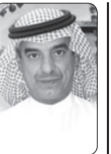
محمد بن عبدالله الحسيني

سعودي يؤدي التحية للسيارة التي حملت الملك رحمه الله بعد وفاته قد أثرت في أكثر من أي شيء آخر، فقد بدا الجندي في وقفته مجسدا لكل الشعب السعودي الذي كان حبل الود بينه وبين قائده رحمه الله أكبر بكثير من حسابات السلطة والمسألة التي تحكم عادة العلاقة بين الحاكم والمحكوم. عزأنا بالطبع في خلفه خادم الحرمين الشريفين الملك سلمان بن عبدالعزيز حفظه الله الذي تربي في بيت القائد الأكبر الملك المؤسس رحمه الله وقاد الرياض طوال خمسين عاما نحو التطور والمدنية، وله باع طويل في السياسة الخارجية، وحضور لافت لدى دول العالم فضلا عما يمتاز به من ثقافة وإطلاع في كافة المجالات الفكرية والثقافية، ونسال الله أن يعينه ويوفقه ويوفق صاحب السمو الملكي الأمير مقرن بن عبدالعزيز آل سعود ولي العهد نائب رئيس مجلس الوزراء، وصاحب السمو الملكي الأمير محمد بن نايف بن عبدالعزيز آل سعود ولي ولي العهد النائب الثاني لرئيس مجلس الوزراء وزير الداخلية لخير الأمة العربية والإسلامية دائما وأبداً.