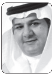
د. فهد بن نايف الطريسي

لقد كان يوم الجمعة ١٤٣٦/٤/٣ يوماً حزينا ليس على المملكة العربية السعودية فحسب، ولكن أيضا على الأمة العربية والإسلامية، فقد تلتفت النبا الفاجع في قاهرة المعز وكان جميع من التقى في نزل الإقامة أو في طريقي للمطار يقدم واجب العزاء. وفي هذا المقام لا يسعنا إلا أن نؤكد ويكلم حزم وجرم أن الأمة الإسلامية والعربية فقدت رجلا قلما جاد الزمان بمثله، كيف لا وهو صاحب الحوار في الداخل والخارج وهو أبو المبتعثين وصاحب التوسعة الأعظم في تاريخ الحرمين إضافة إلى إدخال بلاده إلى نادي دول العشرين، وقد ورث الملك عبدالله عن والده صفات رائعة في القيادة والحكمة، وقوة البصيرة وأهمها القبول لدى الآخرين. رحم الله الملك عبدالله عاش بسيطا متواضعا، لا يعرف الكبر ولا التعالي، فهو يؤمن أن الناس سواسية كأسنان المشط، ولذا كان يرى نفسه دائما بين البسطاء من الناس، يتعامل مع الكل بسماحة وطيب نفس منه، وبرحابة صدر لا يعرف الملل أو الضيق إليه سبيل. كان رحمه الله يسعى بكل جد وصبر ومثابرة ليعم السلام جميع الأرض، وأن يعيش الجميع في وئام وسلام وسعادة، ولذا كان يؤمن بالحوار البناء ويسعى إليه، ولا يتعصب لرأيه ولا لقوميته، بل كان تعصبه للحق، وإعلاء كلمة الله بين البشر، فكان لا يتناصر باطلا، ولا يظلم إنسانا مهما كانت ديانتة أو لغته أو لونه أو جنسه. كان محبا ومولعا بالعلم، فقد أطلق برنامجه للابتعاث الخارجي الذي يسعى إلى المساهمة في تنمية وإعداد الكوادر البشرية السعودية وتأهيلها على نحو فاعل يحقق أهدافه ورؤيته. وعلى المستوى السياسي كان رجلا مخضرا ذا وعي سياسي، وذا خبرة بشؤون المملكة، عالما ومطلعا على قضايا أمتة، يحسب