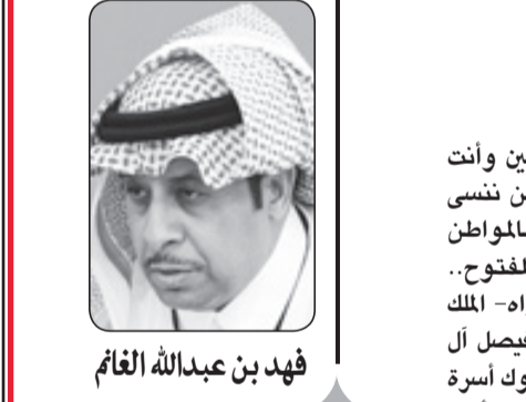
فهد بن عبدالله الغام

لوزارة المالية باستمرار صرف بدل غلاء المعيشة للمواطنين بنسبة ١٥٪. وكانت لفظة كريمة منك تهدف إلى التخفيف من آثار العوامل التي أدت إلى إيجاد بدل غلاء المعيشة. حينها شكر المواطنون على جزيل عطاك ودعوا لك بالصحة والعافية. مات حبيب الشعب.. عبدالله بن عبدالعزيز الملك الإنسان.. التواضع والأريحية والشفافية طبع أصيل لك في شخصيته.. إنها سنة الله في الحياة، اقتضت أن كل أمر قد بدأ نهاية حتمية لا بد منها. نعزي لولك زعيم من زعمائه المؤثرين.. نعزي للعالم بفقدان زعيم من زعمائه المؤثرين.. نعزي لرجال خادم الحرمين الشريفين والأسرة المالكة الكريمة.. ولا شك إنه الموت الذي لا يعرف صغيرا أو كبيرا.. فقد قال الله جل جلالته في محكم كتابه العزيز: "كل نفس ذائقة الموت وإنما توفون أجوركم يوم القيامة". آل عمران ١٨٥ الآية.. أمنا بالله وبقره والى جنات الخلد إن شاء الله.. "إننا لله وإننا إليه راجعون"