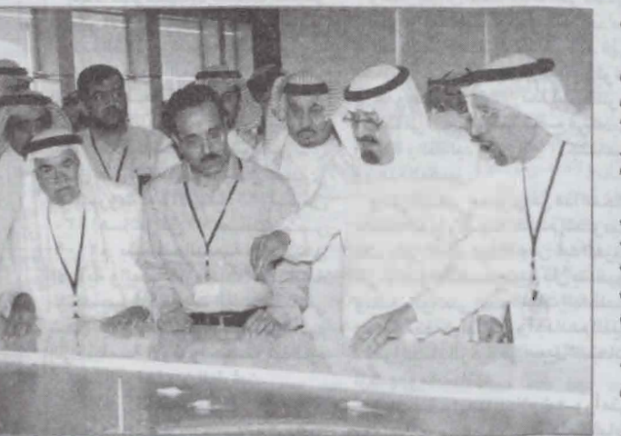
وملاحظاته - أيده الله - رافق خادم الحرمين الشريفين في الزيارة صاحب السمو الملكي الأمير مقرن

بن عبدالعزيز رئيس الأستخبارات العامة وصاحب السمو الأمير فيصل بن عبدالله بن محمد آل سعود وزير التربية والتعليم وصاحب السمو الملكي الأمير خالد بن عبدالله بن عبدالعزيز عضو مجلس أمناء الجامعة وصاحب السمو الأمير تركي بن عبدالله بن محمد آل سعود مستشار خادم الحرمين الشريفين وصاحب السمو الملكي الأمير عبدالعزيز بن عبدالله بن عبدالعزيز مستشار خادم الحرمين الشريفين وصاحب السمو الملكي الأمير منصور بن ناصر بن عبدالعزيز مستشار خادم الحرمين الشريفين وصاحب السمو الملكي الأمير الدكتور بندر بن سلمان بن محمد آل سعود مستشار خادم الحرمين الشريفين وصاحب السمو الملكي الأمير فيصل بن خالد بن عبدالله بن عبدالعزيز وصاحب السمو الملكي الأمير بدر بن عبدالله بن عبدالعزيز وعدد من كبار المسؤولين