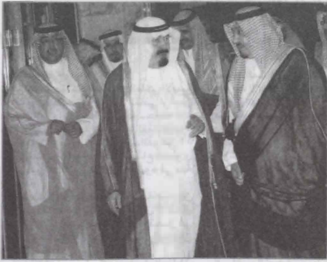
الطيبشي. وكان خادم الحرمين الشريفين الملك عبدالله بن عبدالعزيز آل سعود قد غادر بحفظ الله ورعايته جدة في وقت سابق من مساء اليوم نفسه وكان في وداعه عدد من المسؤولين. حفظ الله خادم الحرمين الشريفين في سفره وإقامته ■