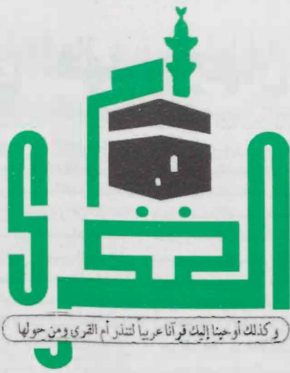
وكذلك أوجينا إليك قرآنا عربيا ننشر أم القرى ومن حولها