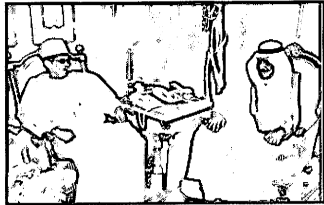
الرياض - واس

استقبل صاحب السمو الملكي الأمير نايف بن عبدالعزيز النائب الثاني لرئيس مجلس الوزراء وزير الداخلية في مكتب سموه بالوزارة مساء يوم الأربعاء ١٨ جمادى الأولى ١٤٣٠هـ الموافق ١٣ مايو ٢٠٠٩م سفير جمهورية مالي لدى المملكة محمد محمود بن لبات. وجرى خلال الاستقبال بحث عدد من الموضوعات ذات الاهتمام المشترك بين البلدين ■