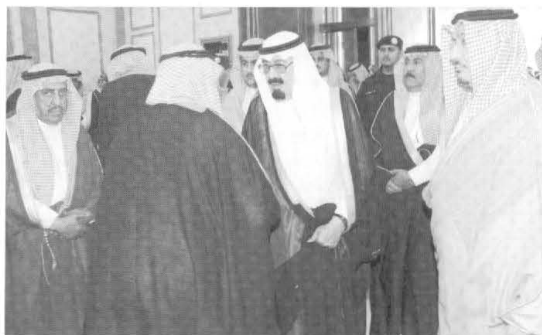
حضر الاستقبال عدد من المسؤولين، كما استقبل صاحب السمو الملكي الأمير