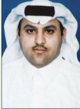
وليد بن محمد الحقباني

الحربية: لقد أكني سماع نبأ وفاة خادم الحرمين الذي لم يفقده الشعب السعودي فقط بل الأمتان العربية والإسلامية حيث عرف عنه التواضع وقربه من الشعب وحبه للعلماء وداثماً في حديثه يذكر ويحث على الدين والتمسك بالعقيدة وكان يكره أن يلقب بمولاي أو ملك الإنسانية بل يفرح بخادم الحرمين الشريفين ومن حسن خاتمته وفاته ليلة الجمعة، وروي عن الرسول قوله ما من مسلم يموت يوم الجمعة أو ليلة الجمعة إلا وقاه الله فتنة القبر... فرحم الله خادم الحرمين الشريفين عبدالله بن عبدالعزيز.