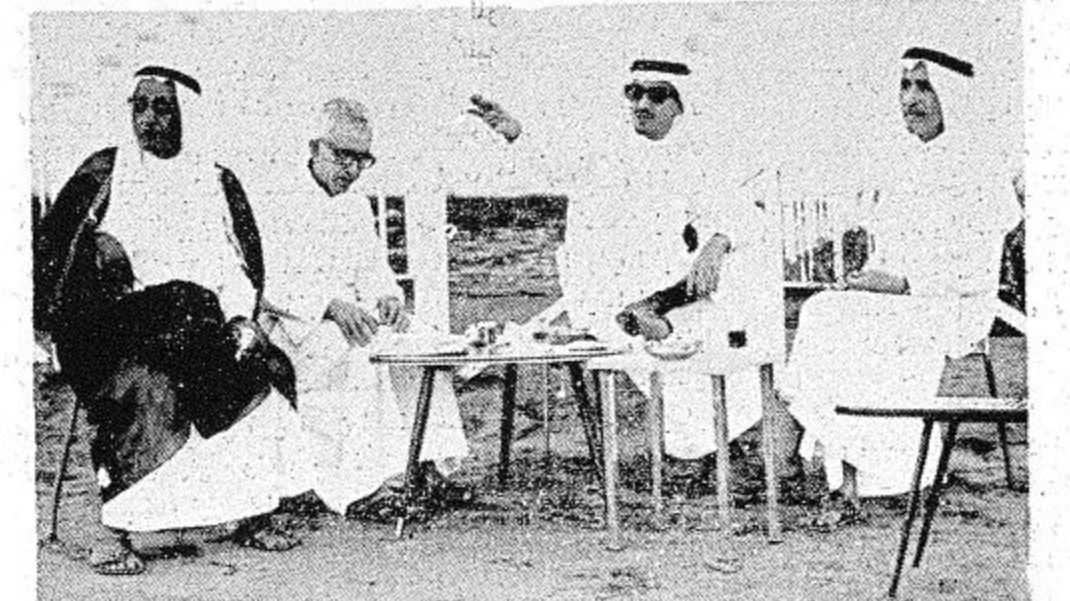
لجنة التشبيبية برئاسة نائب الرئيس سمو الامير خالد الفيصل ( رافع يده ) وعلى يساره الشيخ عبد الله ابا الخيل ، والى يساره الشيخ سليمان الحسن أعضاء لجنة التشبيبية وبينهما الاستاذ رشيد دشان يسجل وقائع تشبيبية الخيول

الفرص المفضل المعظم حفظه الله ، ان تهتم بهذه الرياضة العربية الهامة ، وان توليها حقها من الرعاية والتشجيع ، فعملت على انشاء ناد للفروسية ، وتم تاسيسه بالفعل منذ عام ١٣٨٦ هـ . وقد اشترك في تاسيسه عبد من اصحاب السمو الملكي الامراء واصحاب المعالي الوزراء واصحاب السعادة كبار رجال الدولة واعيان البلاد . ويتألف مجلس ادارته من : صاحب السمو الملكي الامير عبد الله بن عبد العزيز رئيساً ، صاحب السمو الملكي الامير نايف بن عبد العزيز نائباً للرئيس ورئيس اللجنة التشبيبية ، صاحب السمو الملكي الامير ماجد بن عبد العزيز عضواً ، صاحب السمو الملكي الامير سلمان بن عبد العزيز عضواً ورئيساً للجنة السباق والتحكيم ، صاحب المعالي الشيخ حسن المشاري عضواً وممثلاً لمجلس ادارته . صاحب السعادة الشيخ محمد ابا الخيل عضواً ورئيساً للجنة المالية . صاحب السعادة الشيخ عبد العزيز النزيان عضواً واميناً للصندوق . صاحب السعادة الشيخ عبد الرحمن المرشد عضواً وسكرتيراً للمجلس . صاحب السعادة الدكتور عبد العزيز الخويطر عضواً وعضواً في اللجنة المالية . وتتألف لجنة تشبيبية الخيول من : صاحب السمو الملكي الامير نايف بن عبد العزيز رئيساً ، صاحب السمو الملكي الامير خالد الفيصل نائباً للرئيس ، سعادة الشيخ عبد الله بالخيول عضواً .