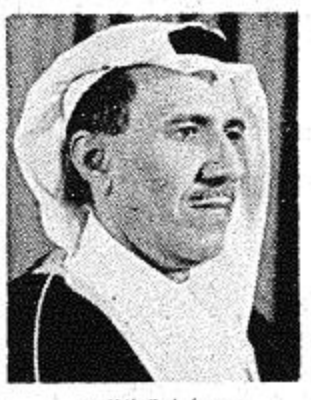
مدير ادارة النادي