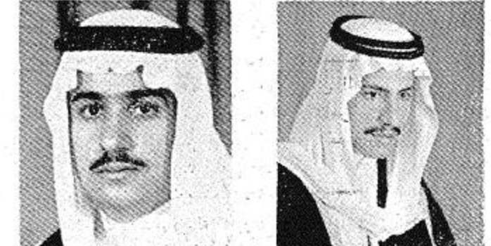
الامير فيصل بن بندر وسلمان بن محمد من امراء الشباب المواطنين على رياضة الفروسية