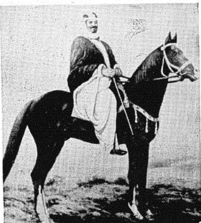
المؤسس الفارس المغفور له الملك عبد العزيز