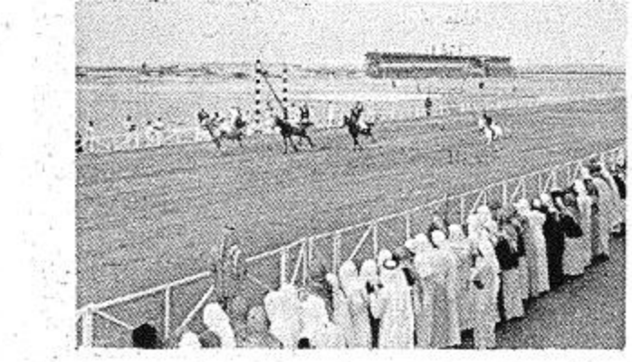
الخيول عند انطلاقها من ( الستار )