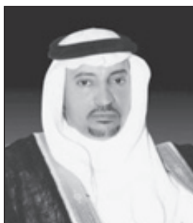
د. عبدالعزيز الفزري

كما أن له برحمته الله جهوداً عظيمة في رعاية مشروعات توسعة الحرميين الشريفين وعطائه السخي للمنجزات التنموية في كل منطقة، وحرصه على رفاهية شعبه وتحقيق مستويات رفيعة من الخدمات لهم في كل مجال، ومن جهوده الخارجية البارزة، دعمه لبرامج التواصل مع الحضارات وحوار الأديان، التي نبعت من جهوده وبوره الكبير؛ في تشكيل الحالة السياسية وتوجيهها نحو نشر السلام وتحقيق التكامل مع بلدان العالم، من خلال تلك المنجزات والأطروحات التي خدمت هذا الجانب سياسياً واقتصادياً وفكرياً، وفي ما قدمته هذه البلاد للبشرية جمعاء في الدعوة لمحاربة الإرهاب ودعم الجهود للوقوف في وجهه سعياً لإنقاذها من شرورها مادياً ومعنوياً.