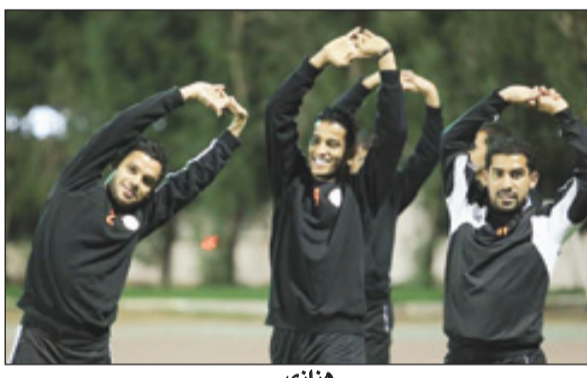
هزازي الكروي الأول برنامجه التدريبي بمعسكره الخارجي في مدينة العين الإماراتية، تحت الفنية.

إشراف مدرب الفريق "جايمي باتشيكو" الذي قسم الفريق لمجموعتين، الأولى ضمت المشاركين في لقاء الأمس الودي أمام الوحدة الإماراتي، حيث أخضعهم لتمارين استرجاعية، فيما أدت المجموعة الثانية (غير المشاركين) تدريبات إجماع وتمسخين، ولياقية، تلاً ذلك تدريبات تكتيكية علي منصف الملعب، ليختتم "باتشيكو" التدريبات بتقسيمه طبق من خلالها اللاعبون عدداً من الجمل