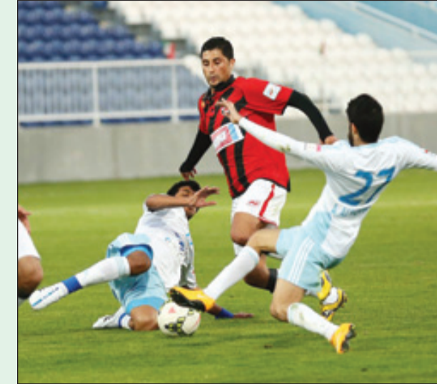
مباراة الراي دويني ياس الإماراتي خلال معسكر الأول في أبوظبي