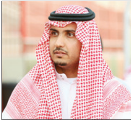
الأمير فيصل بن عبدالعزيز بن ناصر يوقفهم وأن يكون عهدهم عهد خير ورخاء للوطن والمواطن.