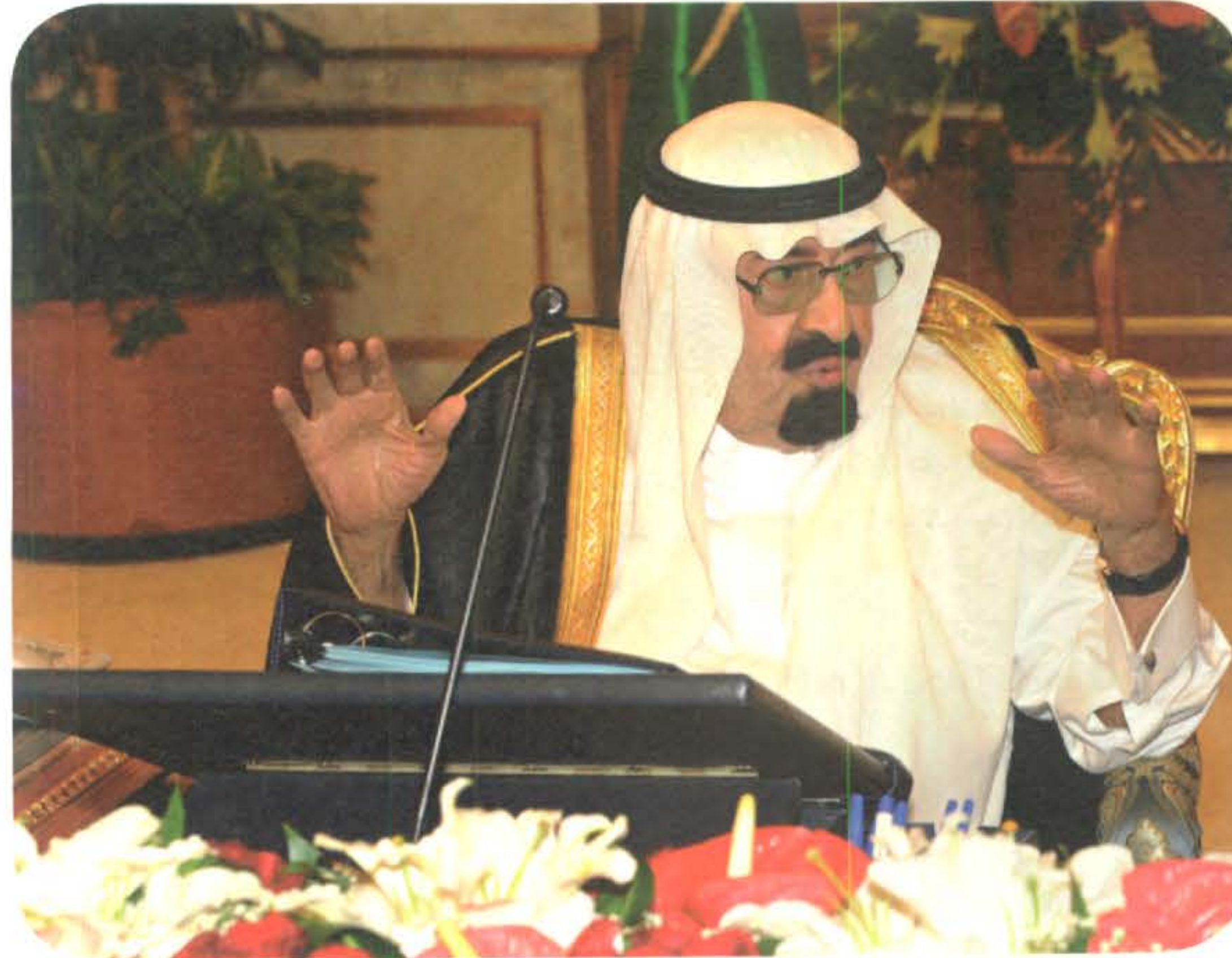
التفاصيل ص ٢-٣

تلقى خادم الحرمين الشريفين الملك عبد الله بن عبد العزيز آل سعود اتصالاً هاتفياً يوم الثلاثاء ٦ شعبان ١٤٣٣ هـ الموافق ٢٦ يونيو ٢٠١٢ م من دولة رئيس وزراء تركيا رجب طيب أردوغان أعرب عن تعازيه لخادم الحرمين الشريفين في وفاة صاحب السمو الملكي الأمير نايف بن عبد العزيز آل سعود رحمه الله. وقد شكر خادم الحرمين الشريفين دولته على مشاعره الطيبة سائلاً الله للفقيد الرحمة والمغفرة. كما جرى خلال الاتصال استعراض العلاقات الثنائية بين البلدين الشقيقين وبحث الأوضاع على الساحتين الإقليمية والدولية.