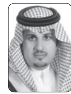
منصور بن سليمان العساف

رحم الله فقيد الوطن عبدالله بن عبدالعزيز الذي كان يوم إعلان وفاة خادم الحرمين الشريفين الملك عبدالله بن عبدالعزيز آل سعود -رحمه الله- من أصعب الأيام التي مرت على الشعب السعودي كله، صغيرهم وكبيرهم، فكانت الفقد في قلوب الناس سامقة، ومحبتهم في القلوب متكتكة، ولكننا لا نقول إلا ما يرضي ربنا (إنا لله وإنا إليه راجعون). الملك عبدالله بن عبدالعزيز -رحمه الله- هو والد الجميع، نشعر بأبوته الحانية في كل