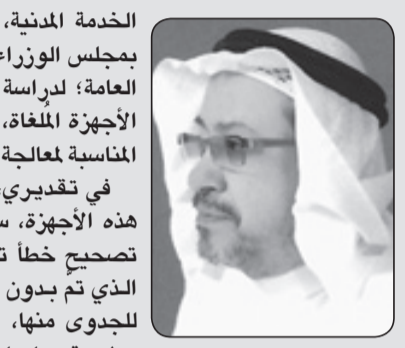
د. عبدالمجيد بن محمد الجلال

وسياسات، فعالة في كافة الشؤون الداخلية والخارجية للدولة. على كل حال، يمكن إدراج هذه القرارات التقنيية، بصورة، أشمل، في حرص خادم الحرمين الشريفين الملك سلمان بن عبد العزيز -حفظه الله-، تدشين عهده، بسياسات، أكثر حيوية، ومسؤولية، وعملية، للمحافظة على وهج عمليات التنمية المستدامة، وترشيد الإنفاق العام! وإعطاء زخم أكبر للدور السعودي على المستويين الإقليمي والدولي؛ والاستعداد لمواجهة كل التحديات والمخاوف القائمة والمحتملة؛ ومنها الصراعات والقتال الإقليمية، وقضايا الطاقة والنفس.. الخ. مسك الختام: