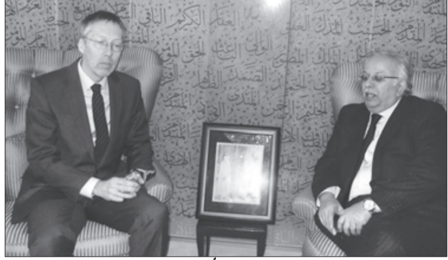
مندوب البرتغال مقبماً تعازي حكومته

وفي تصريح آخر لـ "الرياض" قال مندوب المغرب الدائم لدى الأمم المتحدة السفير عمر هلال عن وفاة -المغفور له بإذن الله- خادم الحرمين الشريفين الملك عبدالله بن عبدالعزيز "باسم الخاص وباسم البعثة المغربية أتقدم بصادق وأعظم التعازي للملك سلمان بن عبدالعزيز وللعائلة المالكة ولشعب المملكة الشقيق في وفاة الملك عبدالله بن عبدالعزيز -تغمده الله بواسع رحمته وغفرانه، كما أقول ان العائلة المالكة والحكومة والشعب في المملكة المغربية يشاطرون بالحزن والأسى اشقائهم في السعودية خاصة وأنتنا في المملكة المغربية نعتبر المملكة العربية السعودية بلدنا الثاني ونعتبر كل السعوديين اخوان لنا خاصة الملك عبدالله بن عبدالعزيز، فقد كان