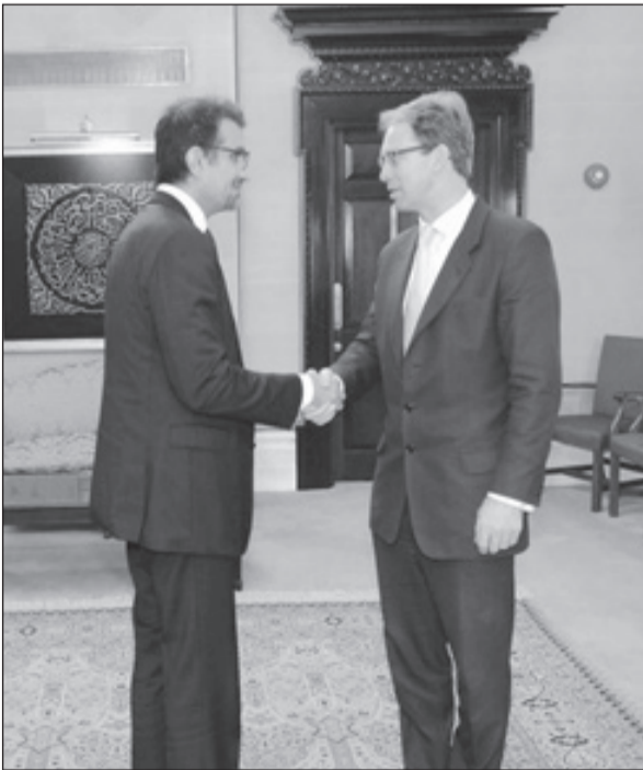
الوزير الوود يعبر عن تعازيه

الوزيرالوود: الملك عبدالله قائد عظيم وصديق حقيقي أكدت: الملك عبدالله أشرف على إحداث تطوير واسع وكبير في المملكة