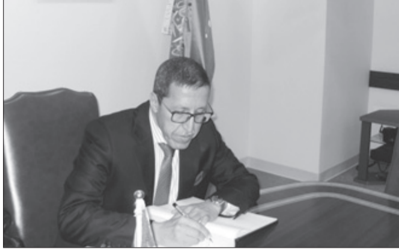
سفير مملكة المغرب يدون تعازيه في سجل رسمي