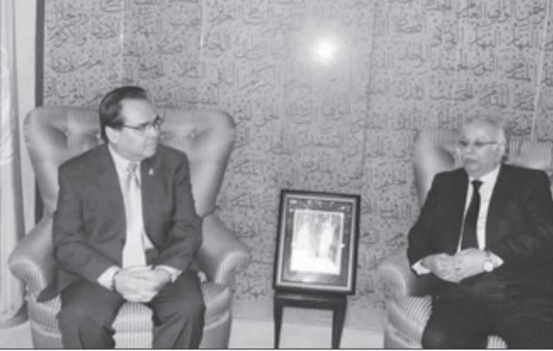
قنصل الفلبين مقبماً تعازيه