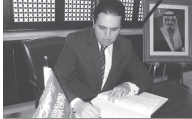
قنصل لبنان يخط كلمات في نكري الفلبين

سفير ألمانيا الاتحادية لدى المملكة لـ "الرياض":