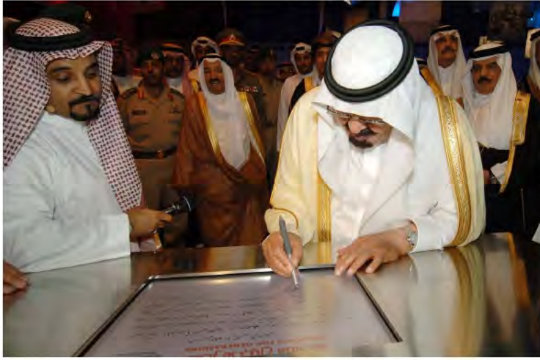
ويشرف حفل أرامكو بمناسبة مرور ٧٥ عاماً