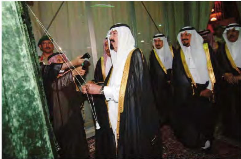
خادم الحرمين الشريفين يضع حجر الأساس لمشروع تظليل الساحات المحيطة بالمسجد النبوي الشريف