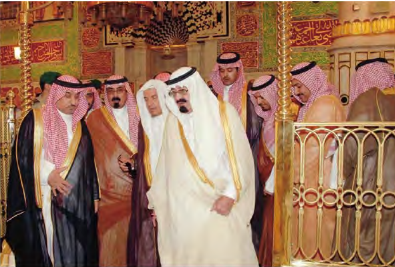
ويزور الحرم النبوي الشريف