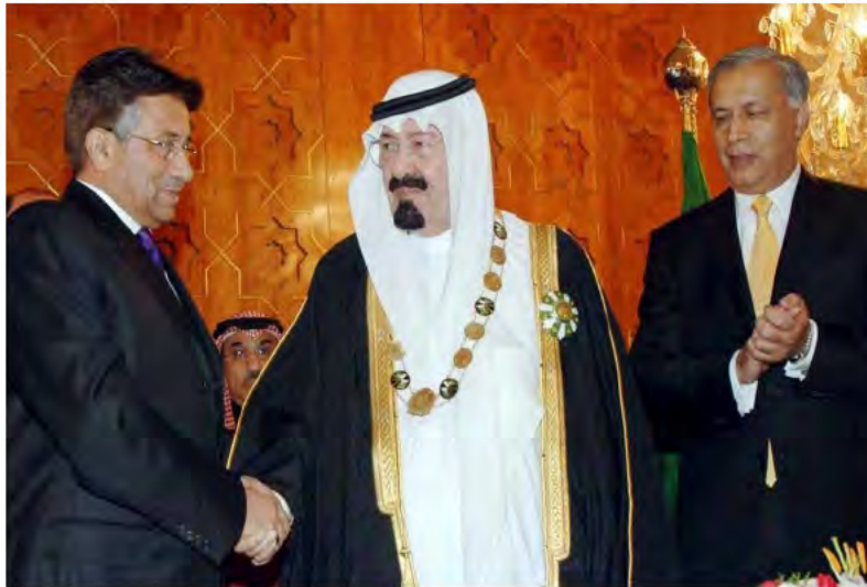
خادم الحرمين الشريفين أثناء تقبله وسام رمز باكستان من الرئيس الباكستاني.

بإنشاء (مركز الملك عبد الله بن عبدالعزيز الدولي للتواصل بين الحضارات) بهدف إشاعة ثقافة الحوار، وتدريب وتنمية مهاراته وفق أسس علمية دقيقة، وإنشاء (جائزة الملك عبد الله بن عبدالعزيز للحوار الحضاري) ومنحها للشخصيات والهيئات العالمية.