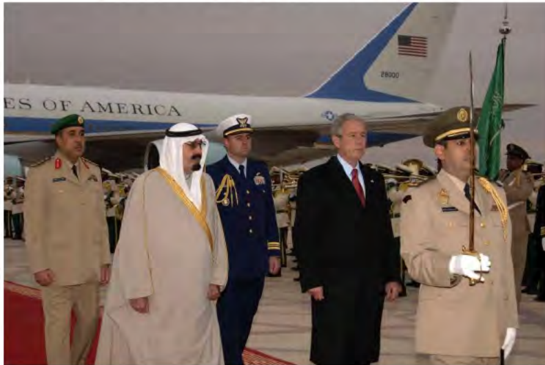
خادم الحرمين الشريفين في استقبال الرئيس الأمريكي.