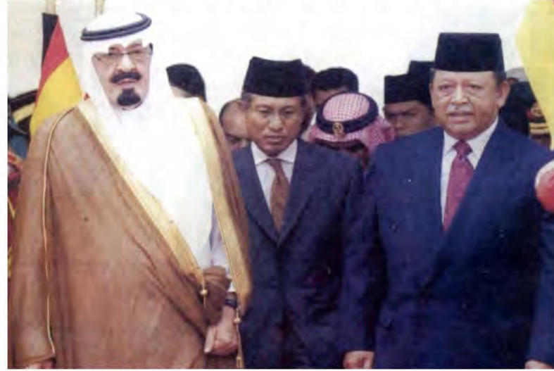
ملك ماليزيا يستقبل خادم الحرمين الشريفين.