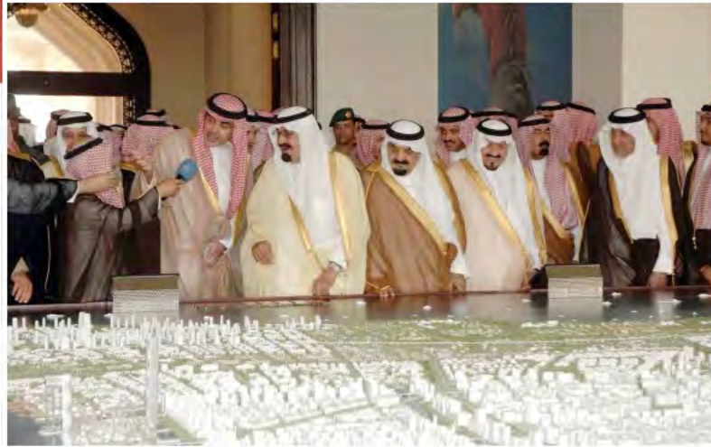
خادم الحرمين الشريفين يطلع على مجسمات بعض المشروعات الاقتصادية بالمدينة الاقتصادية.