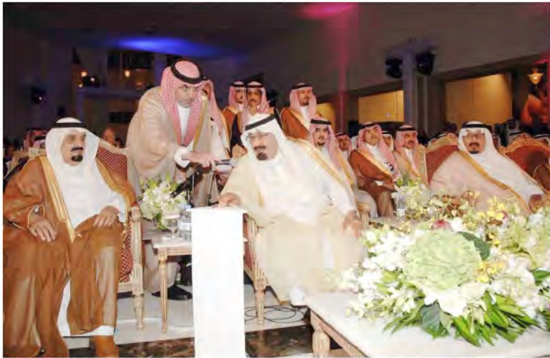
ويدشن عدداً من المشروعات بمدينة الملك عبدالله الاقتصادية.

الوطني بمناسبة وضع حجر الأساس لجامعة الملك سعود بن عبدالعزيز الصحية، والتي أنشئت بناءً على إعلان الملك المفدى تأسيس جامعة علمية متخصصة في العلوم الصحية في ٨/٥/١٤٢٩هـ، وقام بوضع حجر الأساس لخمسة مشاريع هي: (مبنى الجامعة بالرياض)، و (فرع الجامعة بجدة)، و (فرع الجامعة بالأحساء)، و (مستشفى الملك عبدالله التخصصي للأطفال)، و (المراكز الطبية التخصصية).