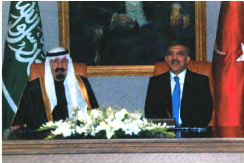
توقيع اتفاقية أنقرة بحضور خادم الحرمين الشريفين وفخامة الرئيس التركي .