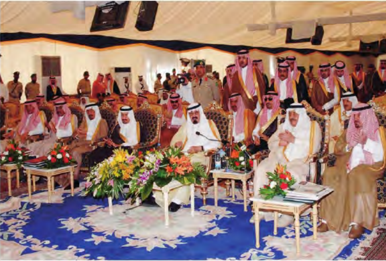
ويضع حجر الأساس لعدد من المشاريع التنموية بمحافظة الطائف.

مساعد الاقتصادية، وتسليم ترخيص المدينة لمجموعة من المستثمرين، ووضع حجر الأساس لمشروع الراجحي التجاري السكني.