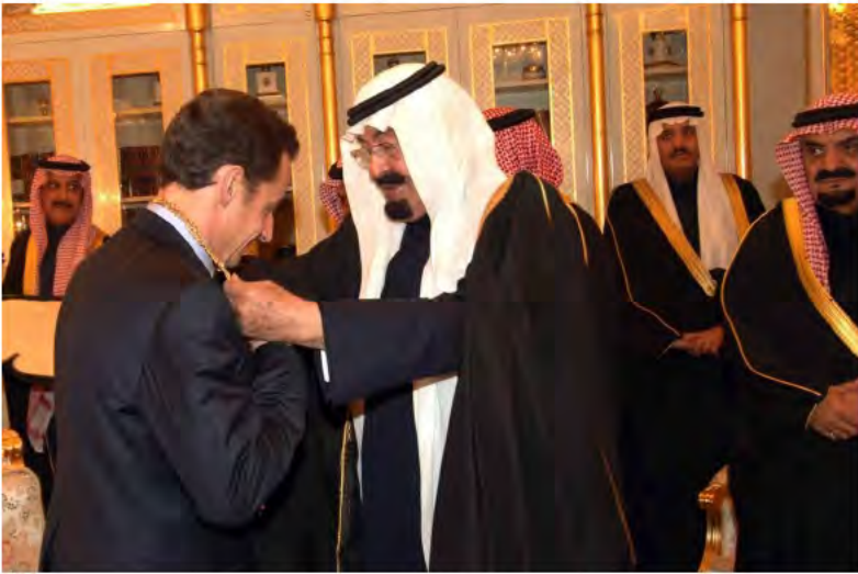
خادم الحرمين الشريفين يقبل فخامة الرئيس الفرنسي قلادة الملك عبدالعزيز.