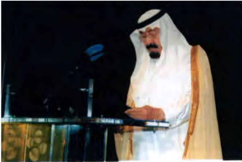
خادم الحرمين الشريفين يلقي كلمة في حفل وضع حجر الأساس لجامعة الملك عبدالله للعلوم والتقنية.

التعليم العالي، ووزارة البترول والثروة المعدنية، ووزارة النقل، ووزارة المياه والكهرباء.