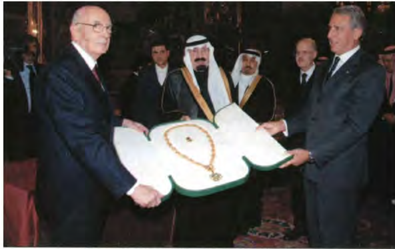
خادم الحرمين الشريفين يقبل الرئيس الإيطالي قلادة الملك عبدالعزيز.