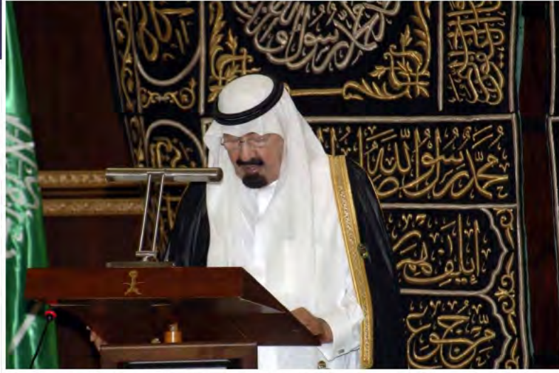
خادم الحرمين الشريفين يتفضل بإلقاء كلمته في المؤتمر العالمي للحوار بمكة المكرمة.