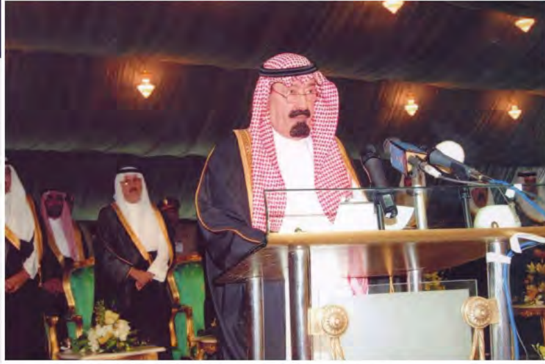
خادم الحرمين الشريفين يلقي كلمة في حفل أهالي نجران