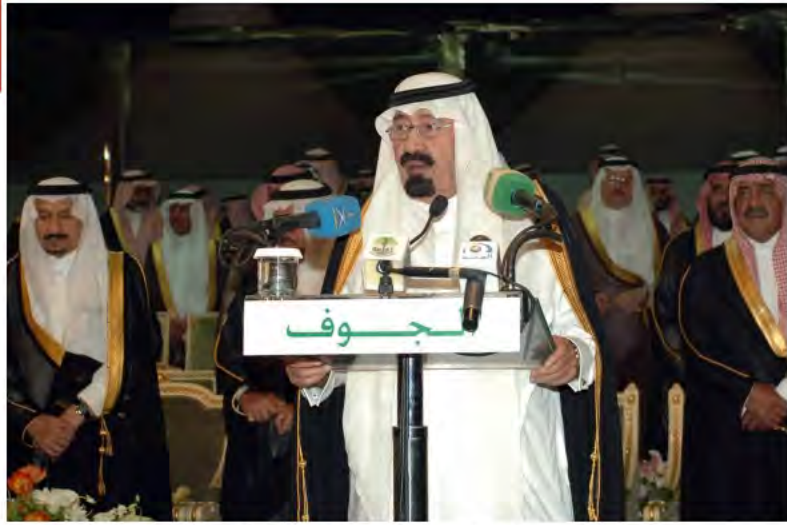
خادم الحرمين الشريفين يتفضل بإلقاء كلمته في حفل أهالي الجوف