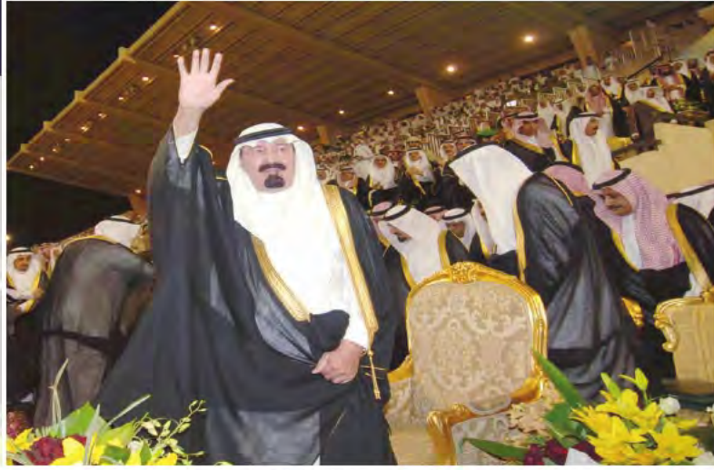
خادم الحرمين الشريفين في زيارة للمنطقة الشرقية