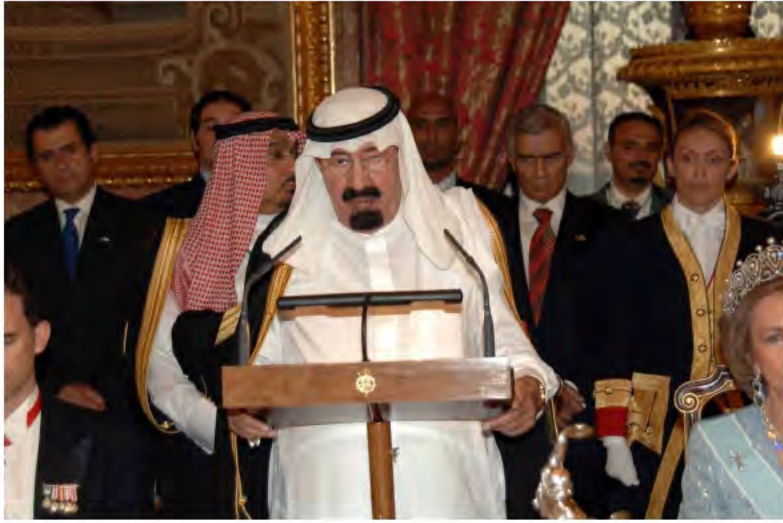
خادم الحرمين الشريفين يلقي كلمة خلال حفل العشاء الذي أقامه ملك أسبانيا.