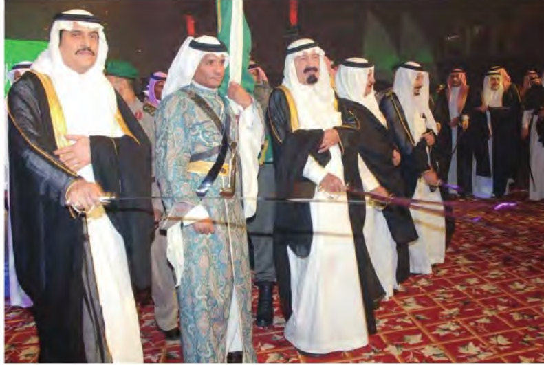
ويشرف حفل أهالي المنطقة الشرقية