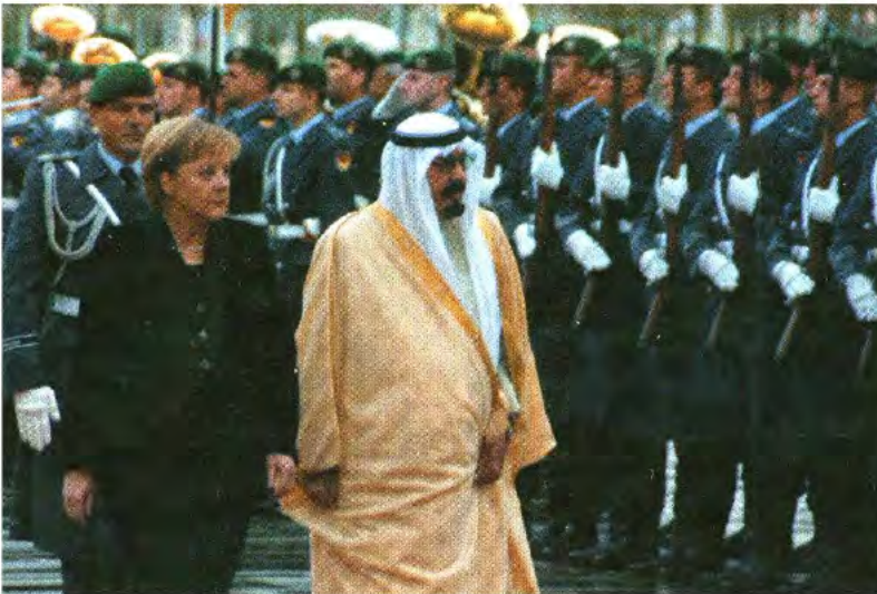
استقبال خادم الحرمين الشريفين في ألمانيا.

النووي الإيراني، وتنقية الأجواء العربية.