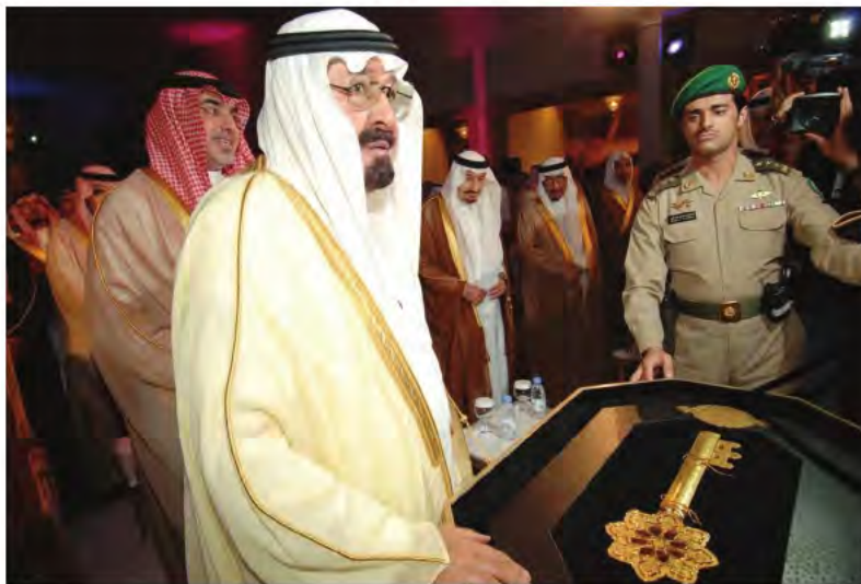
ويتسلم مفتاح المدينة.

التي اجتذبتها المشروع مع إطلاق مرحلته الأولى. وقدم خادم الحرمين الشريفين توجيهاته للقائمين على شركة إعمار المدينة الاقتصادية حول الاتجاهات المستقبلية للمشروع، وأهميتها في دعم العملية التنموية على المستوى الاقتصادي والاجتماعي في المملكة. وبارك خادم الحرمين الشريفين إطلاق منطقة الميناء البحري والمنطقة الصناعية التي تحتضن مدينة الصناعات المتكاملة، وعدداً من المشاريع الرائدة في قطاع البلاستيك.