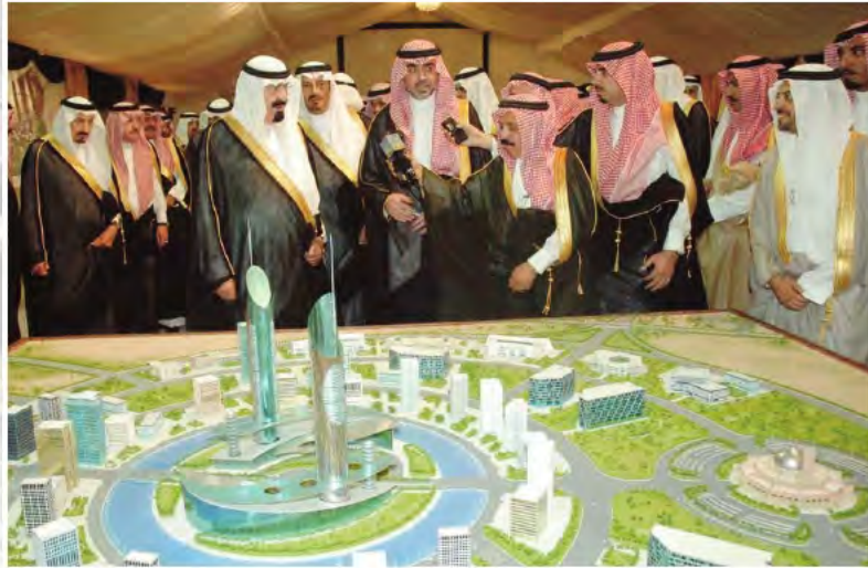
و يرى عدداً من المشروعات التنموية في حائل .

استهل خادم الحرمين الشريفين الملك عبدالله بن عبدالعزيز آل سعود (يحفظه الله) عهده الزاهر بزيارات لعدد من مناطق المملكة، فقام (أيده الله) بزيارة لمنطقة مكة المكرمة، شرف فيها احتفاء الأهالي بتوليته الحكم، وبعدها بفترة زمنية قام خادم الحرمين الشريفين خلال الفترة من ١٤/٥/١٤٢٧هـ إلى ٢٨/٦/١٤٢٧هـ، بجولة شملت المنطقة الشرقية، ومنطقة حائل، والقصيم، والمدينة، والطائف، والباحة.