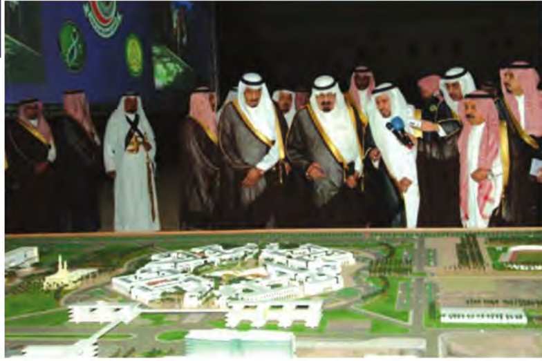
خادم الحرمين الشريفين يشاهد مجسماً لمشروع جامعة الملك سعود بن عبدالعزيز للعلوم الصحية