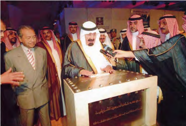
يضع حجر الأساس لعدد من المشاريع التنموية بجيزان.

التعليم الفني، ووزارة الصحة، ومشاريع تعليمية لوزارة التربية والتعليم، كما تم وضع حجر الأساس لتوسعة وتطوير مطار نجران، كما تفضل (أيده الله) بافتتاح عدد من المشروعات الكهربائية.