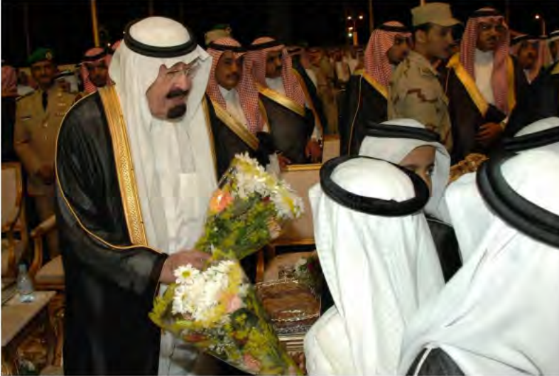
ويستقبل أطفال تبوك.