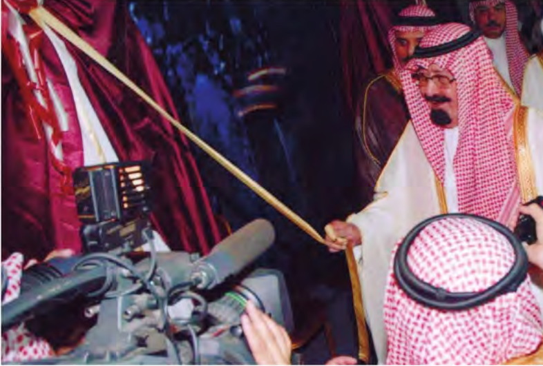
يضع حجر الأساس لعدد من المشاريع التنموية بعسير