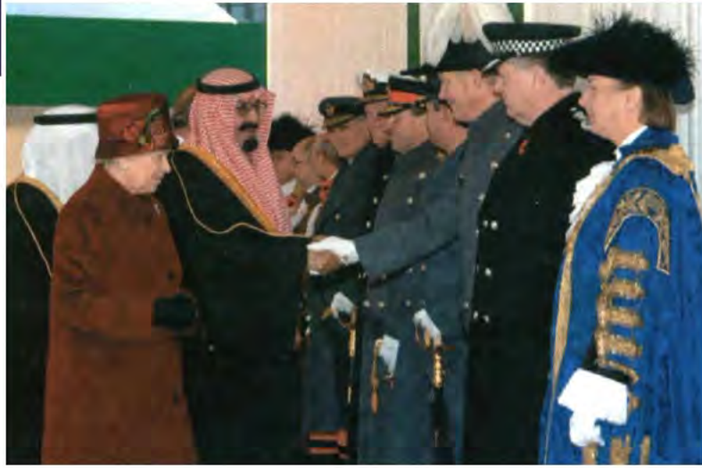
الاستقبال الرسمي لخادم الحرمين الشريفين بلندن.