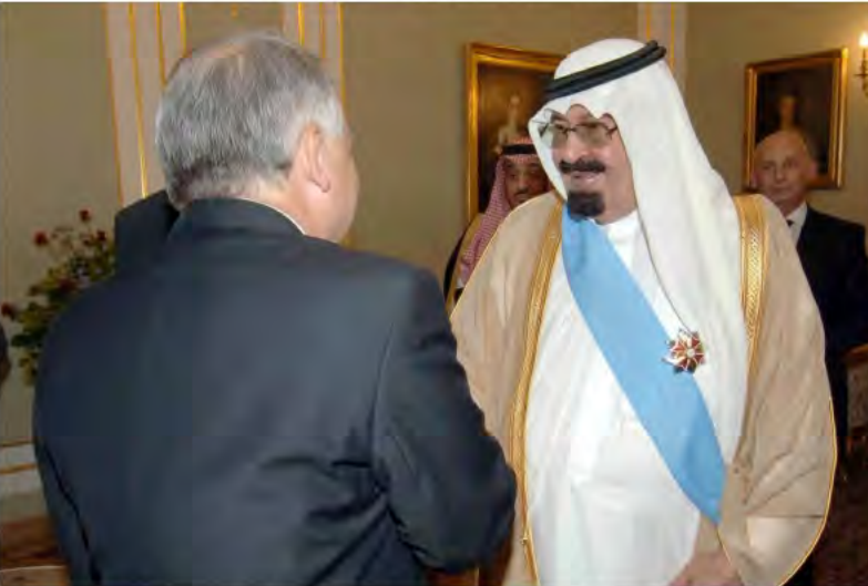
فخامة الرئيس البولندي يقلد خادم الحرمين الشريفين وسام النسر الأبيض.

تحقيق أكبر قدر من التنسيق والتعاون بين الدولتين وفق آليات جديدة، وتوسيع نطاق الاستثمارات المتبادلة، من خلال التوسع في إقامة المزيد من المشاريع المشتركة برأس مال مشترك.