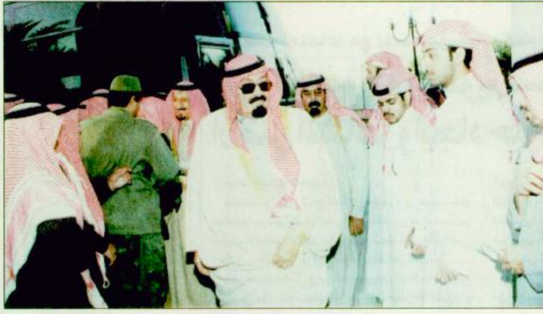
○ وصول سمو ولي العهد الى الرياض

وهذا فان على كافة الدول العربية ان تسعى - بالزهد من الجديدة - للحفاظ منفردة على مواردها المائية والتنسيق - مجتمعة - مع شقيقاتها من أجل ترشيد وحماية موارد المياه من كافة الاطماع، مع الحرص على ان يجيء صوتها موحداً وقويًا بشأن الموارد المائية المشتركة خصوصاً تلك التي تأتي عبر أكثر من دولة، بما يفرضه ذلك من ضرورات حتمية للتنسيق حماية لشريان الحياة المائي للمنطقة العربية بكافة اقطارها.