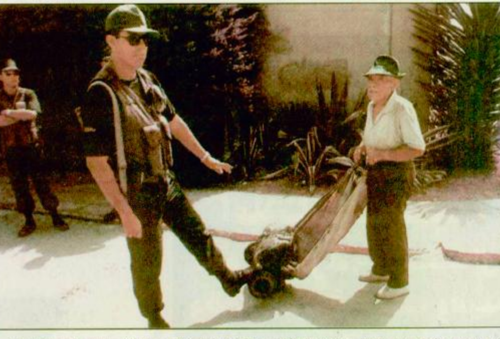
شيرو: بيرو يوفق بيستانيا محليا أثناء محاولة العمل داخل منقطة الجوار الأمني حول السفارة اليابانية

دمشق: رويترز: حضر برلمانيون عرب الحكومات العربية من مخاطر تهديد موارد المياه وطالبوا بإقرار استراتيجية موحدة للدفاع عن الأمن المائي العربي. وطالب البرلمانيون في ختام ندوة حول دور المياه الاستراتيجية للدول العربية بالتعاون فيما بينها للدفاع عن الحقوق العربية في المياه المشتركة مع دول أخرى وضمان الحصول عليها. وطالب البرلمانيون الذين يمثلون 18 دولة عربية القادة للحرب بوضع متطلبات الأمن المائي والغذائي للأجيال المعاصرة والقادمة في مرتبة عالية على سلم الأولويات وحشد الجهود اللازمة لذلك.