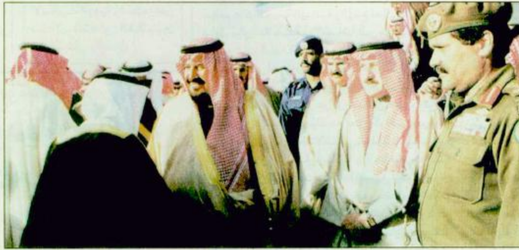
○ وصول سمو الأمير سلطان الى الرياض