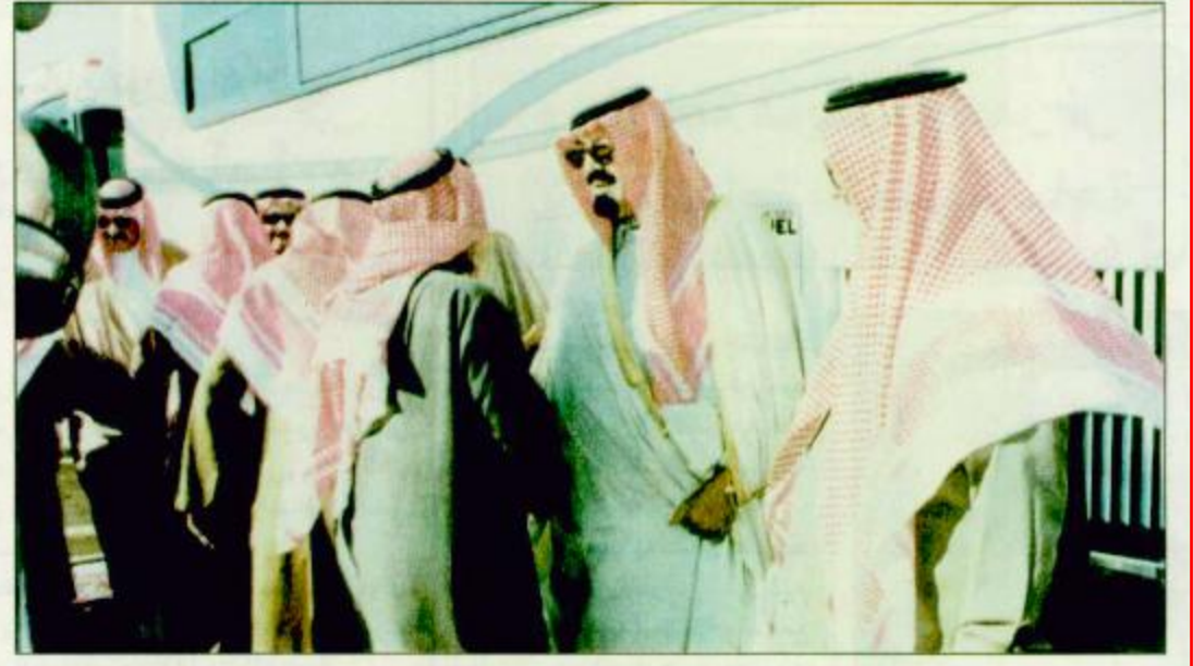
○ مغادرة سمو ولي العهد روضة خريم