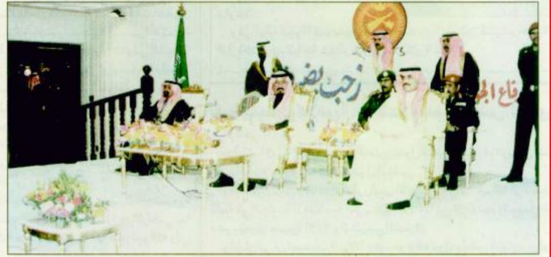
○ سمو الأمير سلطان لدى زيارته لجموعه الدفاع الجوي السادسة بالمنطقة الشمالية