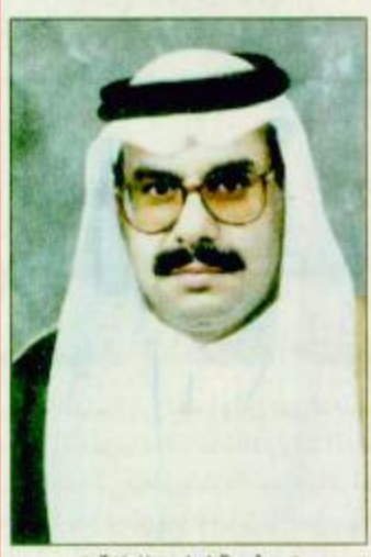
○ سفير قطر لدى المملكة

الحرمين الشريفين الملك فهد بن عبد العزيز وسمو ولي عهده الامين وسمو النائب الثاني وسمو وزير الداخلية على مواساتهم في وفاة والده. ونوه في تصريحات صحفية بأواصر الصداقة والحمية والعلاقات الوثيقة بين قطر والمملكة العربية السعودية وما تحظى به الاسرة الدبلوماسية في المملكة من دعم ورعاية ومنازلة من القيادة السعودية الرشيدة بما يسهم في تعزيز الأمن والاستقرار في منطقة الخليج العربي لتكون مسيرة المجلس أكثر تلاحماً واصراراً على تكريس كافة عوامل الرسوخ والقوة لتكون منطقة الخليج واحدة خيرة وامان لابنائها وللعالم أجمع وأن يظل البيت الخليجي قوياً راسخاً وأكثر تلاحماً.